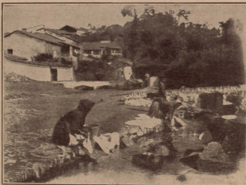
Alrededores de Fuente-heridos

condiciones de reunir los fondos necesarios para esta empresa y se decidió a adquirirlos de los campesinos.