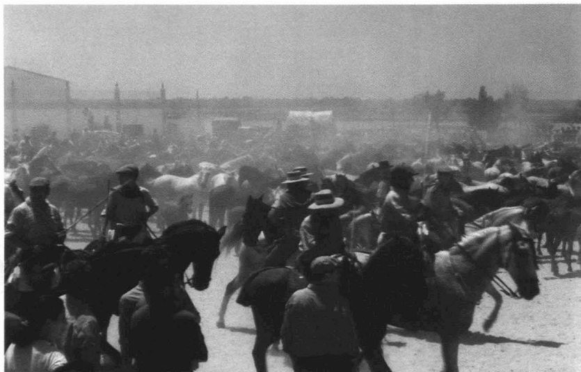
Las yeguas se congregan junto al santuario de la Virgen del Rocío.

Marisma de Hinojos, pertenecientes a los propios de ese Ayuntamiento, todas ellas incluidas en el Parque Nacional. Sin duda, el principal aprovechamiento fue, desde un principio, el ganadero, junto a una variadísima gama de actividades —reguladas unas veces, toleradas otras, clandestinas en ocasiones— como la caza de aves, la pesca de sanguijuelas, galápagos y anguilas, la recolección de caracoles, huevos de anátidas y fochas, y la siega de aneas, castañas u otras plantas.