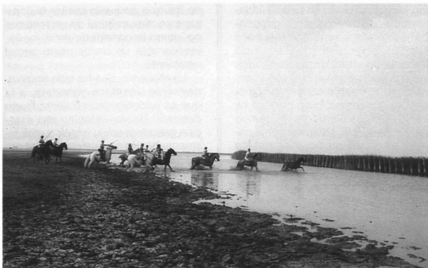
La saca en la marisma de Hinojos en las primeras horas del día.

Sin embargo, la Feria de Almonte siempre tuvo un componente excepcional e insólito que ha perdurado, aunque no ha sido inmune a estos y otros cambios acaecidos en la vida de la comunidad: el anual rodeo de los caballos asilvestrados que pastan todo el año, en libertad, en las Marismas que, desde hace tres décadas, forman parte del vecino Parque Nacional de Doñana. Poco antes de las festividades, los jinetes «sacaban» de sus querencias en esos pagos a yeguas y potros y los conducían, tras varias leguas de camino, hasta los corrales de la población para practicar ciertas tareas ganaderas (la tusa, el herrado, etc.) y reali-