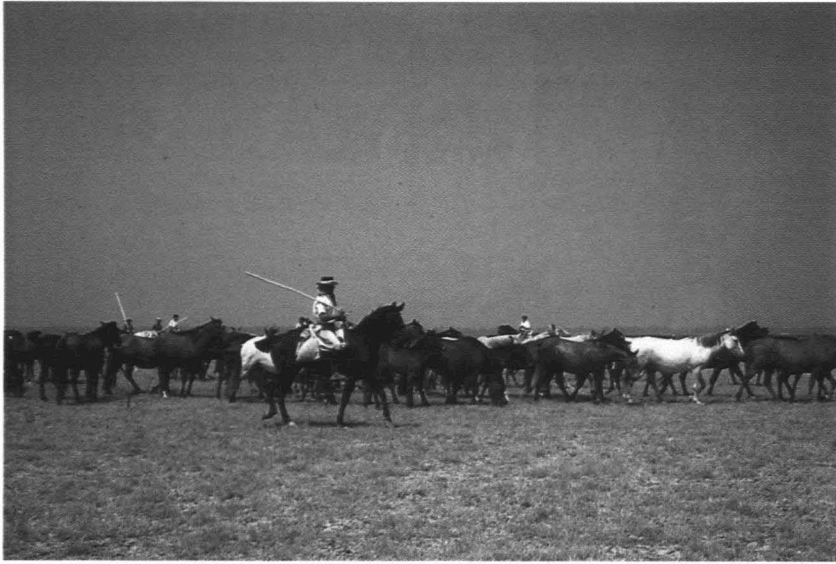
Las tropas de yeguas van abandonando la marisma.

zar actividades de compra y venta. Aunque ha pasado por altibajos, este «otro mercado» de ganado marismeño se ha mantenido y ahora vive una auténtica resurrección. Hasta tal punto que se está convirtiendo, paradójicamente, en el nuevo signo de identidad de la Feria, a la que bien podríamos llamar ya la «Feria de las Yeguas».