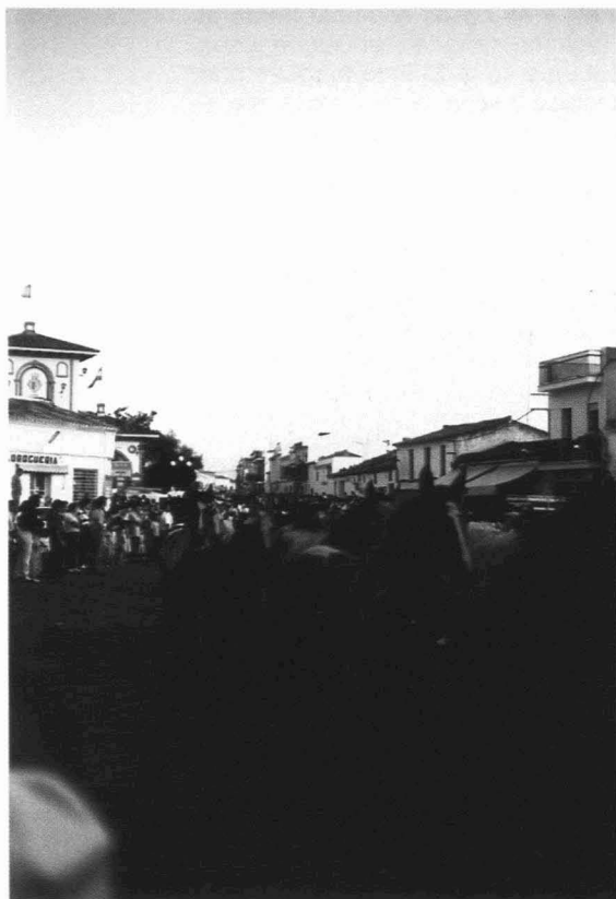
Yeguas por una calle de Almonte.

nocen en vastas extensiones, muchas veces planas y homogéneas, leves señales que les sirven de referencia o de orientación, e incluso, se valen de un lenguaje gestual que a gran distancia, cuando la voz es insuficiente, es el único medio de comunicación para indicar un hallazgo, un peligro u otra idea.