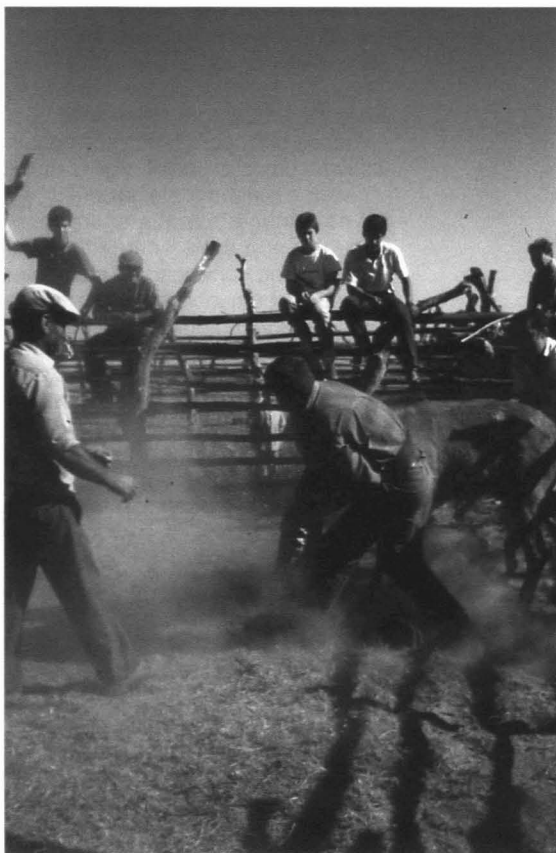
La tusa se realiza en los corrales.