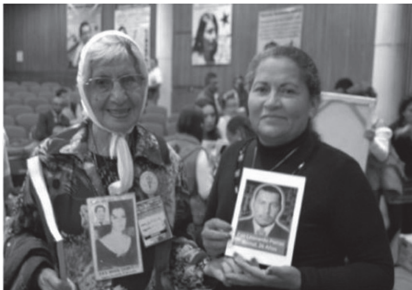
Doña Mirta Acuña (Madre de Plaza de Mayo) y Doña Luz Marina Bernal en el Foro Internacional Colombia entre rejas: Un camino para la paz y libertad. Bogotá 27 de febrero de 2012.

Se exponen sus retratos biográficos, como punto de partida del que parten estas tres mujeres “berracas” 6 , para recorrer un camino de lucha, que ya dura casi cinco años hacia su constitución como sujetas políticas.