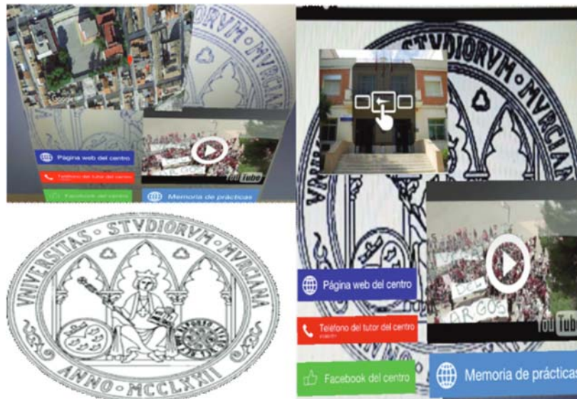
Figura 1. Ejemplo de visualización de la RA.

Por tanto, en esta primera sesión, la acción didáctica se basa en mostrar la superposición virtual sobre la propia realidad, explicando al alumnado un ejemplo de contenidos que podrían presentarse en esta imagen, al objeto de ampliar la información que se quiere indicar al profesor sobre su experiencia en los centros. En la Figura 1 se presenta un ejemplo de visualización de un posible modelo de entrega en el que se parte de una imagen del logo de la Universidad de Murcia.