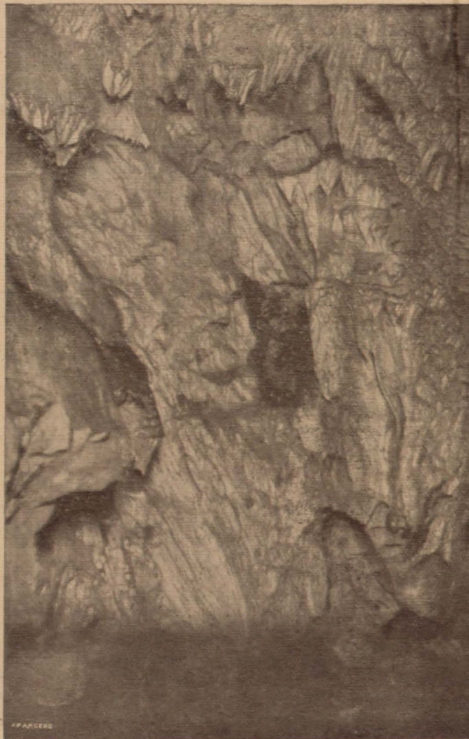
Un interesante aspecto de la "Gruta de las Maravillas"

veraniega. Ya hubo un tiempo en que infinidad de personas de las provincias inmediatas y sobre todo de la de Sevilla, colocando en primer término a la capital, escogieron a nuestra ciudad como residencia veraniega, y para nadie es una novedad que la mayor parte de las