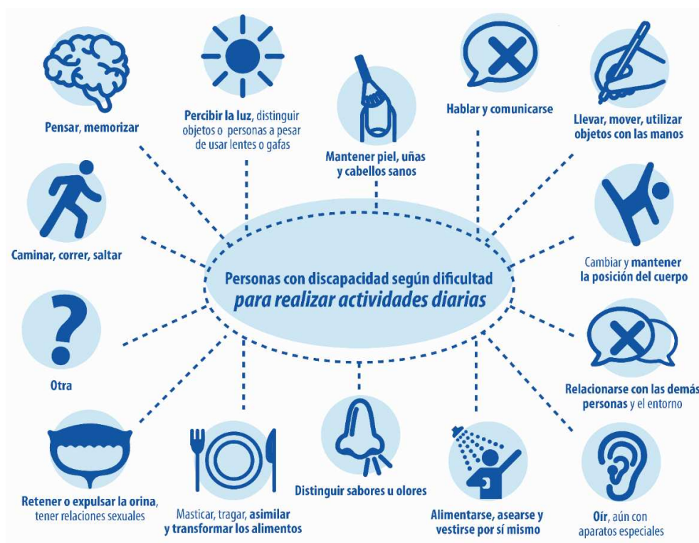
Figura 2. Personas con discapacidad según dificultad para realizar actividades cotidianas, propuestas por la CIF.