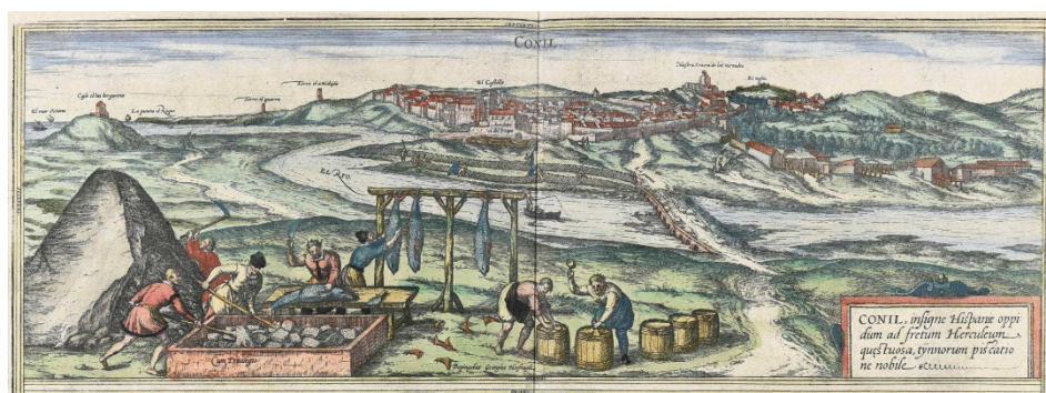
Figura 3. La almadraba en Conil de Joris Hoefnagel en Civitates Orbis Terrarum , Colonia, Georg Braun, c. 1599-1618 (Biblioteca Nacional de España, Madrid)

Pero ¿qué ocurre con la comida? La alimentación durante el viaje era objeto de preocupación y así se advierte en las misivas de los emigrados que recomiendan con profusión el que se lleven provisiones en abundancia dada la larga duración del viaje.