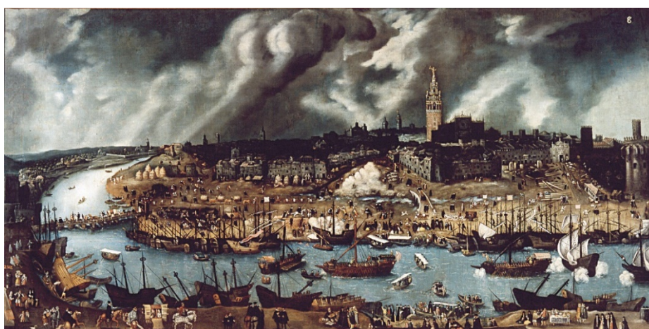
Figura 1. Vista de la ciudad de Sevilla , de Alonso Sánchez Coello (1532-1588) (Museo de América, Madrid)

venta de las mercaderías embarcadas. A estos se unían hombres y mujeres de a pie, de toda clase y condición, para los cuales la esperanza de mejorar su fortuna era su principal motivación y, para ello, debían llevar su matalotaje (equipaje y provisiones), capítulo importante para quienes iban o regresaban de las Indias. Otros autores se han acercado a la alimentación a bordo desde otras fuentes y otras perspectivas 4 . Lo novedoso de este trabajo que presentamos es que damos la voz a los emigrantes y conocemos por ellos mismos qué comían o qué recomendaban embarcar para la travesía. De ahí la importancia de esta fuente: la carta privada.