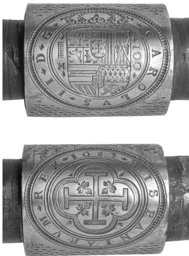
Figura 6. Imágenes de ingenios de acuñación a rodillo, en Glenn Murray "El Real Ingenio de la Moneda, la fábrica industrial más antigua, avanzada y completa que se conserva - Patrimonio de la Humanidad". Cámara Oficial de Comercio e Industria de Segovia.

El Fundidor debería tener un extraordinario conocimiento de los metales, su fundición y afinación, ser hombre veraz y de buen proceder. Suya era la responsabilidad de la oficina de fundición y de su estado y del de sus enseres, salvo el caso de la balanza de pesos cuya responsabilidad era competencia del Juez de Balanza. Tiene facultad para contratar y despedir empleados; su residencia estaría en la Casa de la Moneda y si esto