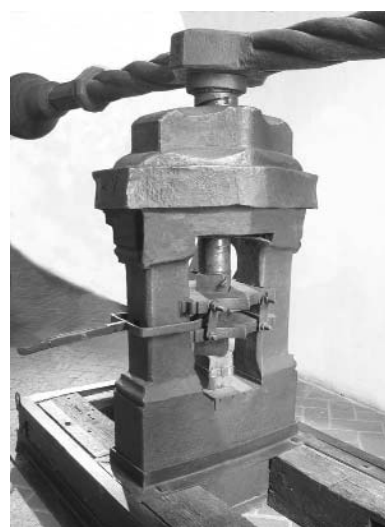
Figura 4. Imágenes de ingenios prensa volante, en Glenn Murray “El Real Ingenio de la Moneda, la fábrica industrial más antigua, avanzada y completa que se conserva Patrimonio de la Humanidad”. Cámara Oficial de Comercio e Industria de Segovia.