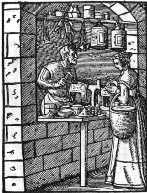
Figura 2. Comerciante. Archivo: Laternenmacher-1568, grabado de Jost Amman y Hans Sachs, Frankfurt am Main, 1568.