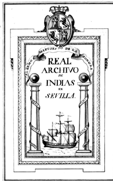
Figura 3. Dibujo de escudo del Archivo General de Indias, presentado por José de Aguilera y Homenaje a D. José de Gálvez, Secretario de Indias, y clave en el nacimiento del Archivo. [1786, noviembre, 11] 295 x 202 mm. MP. Europa y África, 50

Estamos ante otro estado evolutivo de la civilización muy distinto al que tenemos hoy, pero ya aquí la Corona solicita la participación del pueblo en los asuntos de Estado, el régimen no es democrático es autoritario por definición, pero las cosas en la Historia todas tienen su evolución, su proceso y su devenir. Así, una R.O. de 18 de Mayo de 1701 manda a todos los pueblos de España que propusiesen medios para la restauración del comercio; y por Decreto de 5 de Junio y 4 de Diciembre de 1705 el rey dispone formar una Junta, con asistencia de tres ministros de él, cinco del de Indias, dos del de Hacienda, un Togado de la Casa de Contratación de Sevilla y un Secretario, además de dos Intendentes " de la Nación Francesa muy competentes en tema de comercio ", así como otras personas de igual confianza e inteligencia " de diferentes partes y puertos de España ", para que se aplicasen con la mayor eficacia en el fomento del comercio (1ª parte del aut. 6 tit. 12. Lib. 5 R).