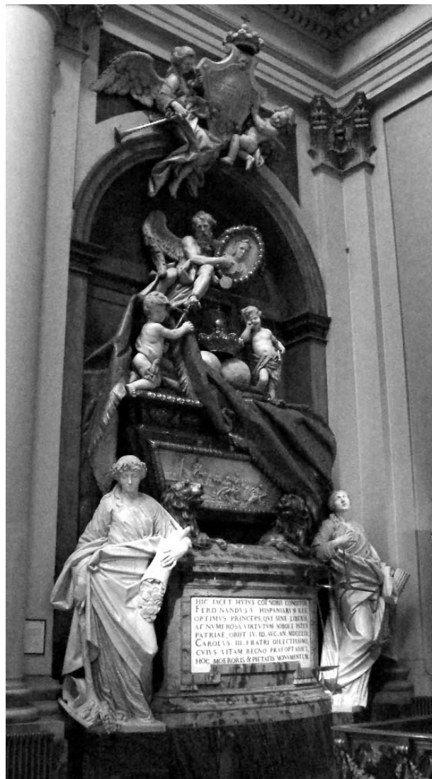
Figura 7. Mausoleo de Fernando VI, Iglesia de S. Bárbara o de las Salesas (1713-1759).

La verdadera reactivación de las explotaciones mineras llegaría con el reinado de Carlos III en el siglo XVIII, también para Andalucía. Este resurgimiento de los antiguos distritos mineros y explotaciones andaluzas se fundamentaba por una parte en la intervención de empresarios extranjeros, fundamentalmente alemanes, en la gestión y administración de las explotaciones andaluzas, instaurando un sistema de acciones sobre los beneficios mineros que ya no se perdería. Por otro lado, la introducción de nuevas maquinarias y avances tecnológicos