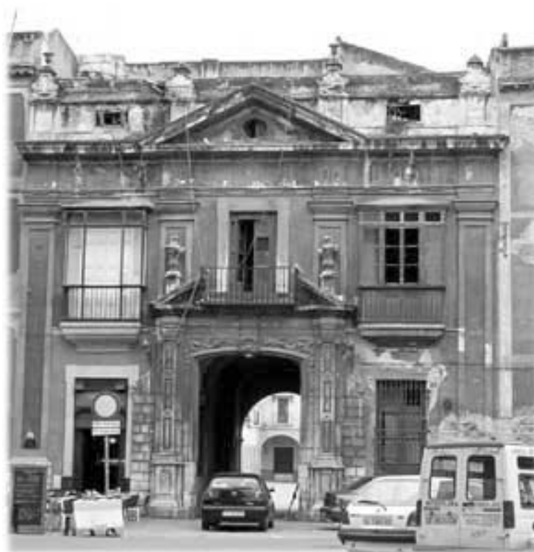
Figura 5. Fachada Casa de la Moneda Sevilla Van der Borch, autor de la portada de la Casa de la Moneda.

La Junta de Comercio se dirigió en consulta al rey por dos veces consecutivas exponiendo el escaso número de ministros que la componían y la necesidad de ampliar su representación para poder dar curso a los negocios que le competían; y atendiendo a la gran conexión de estos ministros y Junta de Comercio con los de la Junta de Moneda, se resolvió que los ministros de ambas atendie-sen a ambas cuestiones y se hicieran cargo de lo que en