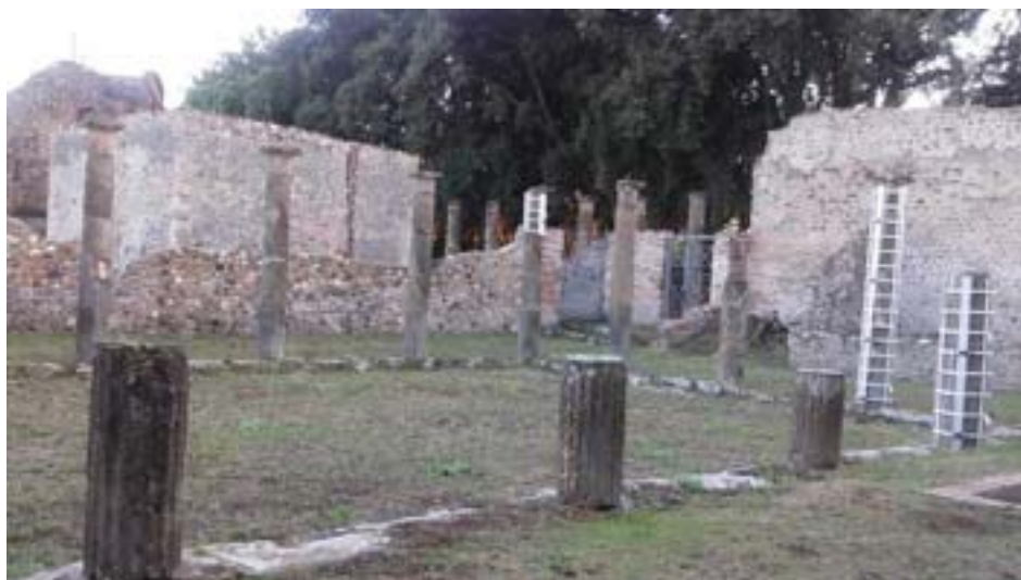
Figura 8. Palestra Samnita. Via del Tempio d'Iside.