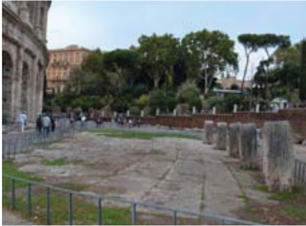
Figura 3. Termini del Coliseo, Roma.