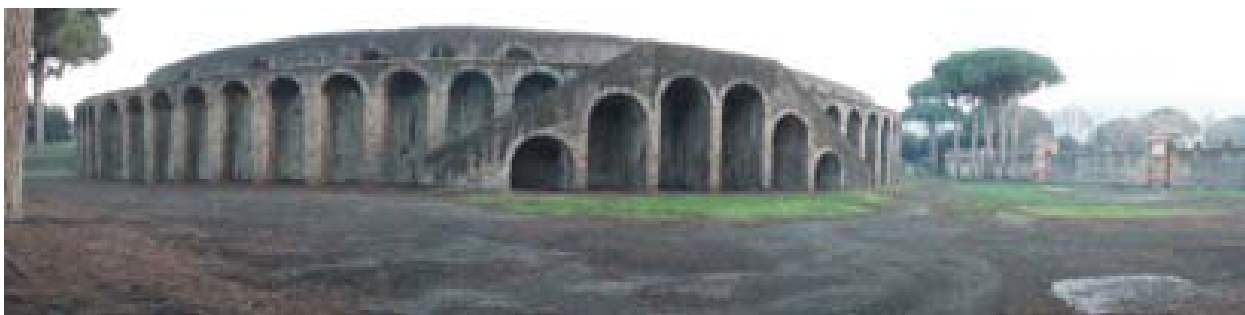
Figura 10. Anfiteatro.

Consiste en un patio porticado, con seis columnas en los lados largos y cinco en los pequeños, donde los ciudadanos iban a realizar sus ejercicios, pues se trata de un gimnasio al aire libre (Mau, 1899, 159; Sogliano, 1899, 19; Etienne, 1971, 348-349 y De Vos y Vos, 1982, 71). Al igual que el odeón se encuentra delimitada por un muro que la rodea que formaría el límite con otras propiedades.