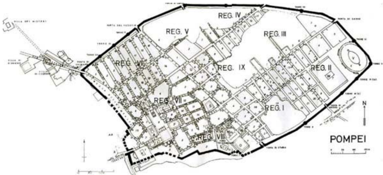
Figura 1. Plano de Pompeya, Eschebach (archaeology.uakron.edu)

zar la groma . Ésta era la herramienta principal que utilizaban los romanos para realizar las mediciones y trazar las líneas sobre el terreno necesarias para la construcción de calles, ciudades, templos, centuriaciones de terrenos agrícolas, etc. Con este sistema posiblemente se iban colocando los mojones para delimitar los lugares públicos y privados tanto dentro como fuera de la ciudad. Los termini seguían un ritual sagrado de colocación, pero no siempre se realizaban estos rituales. El agrimensor Sículo Flaco defiende que era un acto voluntario, porque bajo algunos mojones no hay nada enterrado; pero bajo otros encontramos cenizas, carbones, fragmentos de cerámica o de vidrio, o ases bajo cal o yeso. Este ceremonial nos pone de manifiesto el valor religioso que quería darse a la colocación e inmovilidad de estas piedras, que eran así protegidas no sólo por las leyes municipales, sino por creencias y costumbres tradicionales de índole religiosa (Raposo, 2015, 104). De este modo los termini adquirían un carácter sagrado, por lo que eran honrados como si se trataran del mismo dios Terminus . Se cuenta que el rey Numa estableció el día 23 de febrero como la fiesta de las Terminalia en honor al dios Terminus , en las cuales se realizaba un ritual muy parecido al que se ejecutaba en la colocación de los termini (Daremberg et alii. 1877-1919, 123-124).