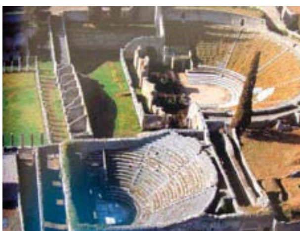
Figura 7. Odeón y teatro.

ron la restauración del pasaje cubierto que da acceso a la tribuna y a la cavea del teatro y contrataron al arquitecto Marcus Artorius para llevar a cabo tal obra (Vinci, 1839, 142; Fiorelli, 1977, 81-82; Mau, 1899, 144; Pellerano, 1910, 12; D'Amore, 1960, 52 y De Vos y De Vos, 1982, 64):