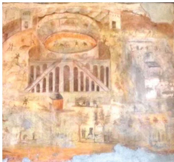
Figura 12. Lucha entre espectadores de Pompeya y Nuceria en el anfiteatro de Pompeya. Representación de comerciantes ambulantes. Museo Arqueológico Nacional de Nápoles. Foto: Noemí Raposo, 2016

54; Etienne, 1971, 184; Richardson, 1989, 135; Beard, 2009, 106; Berry, 2009, 142). Permissu aedilium Cn(aeus) Aninius Fortunatus occ(u)pavit ( CIL IV 1096 ) 13 ; [Per]missu aed[ilium] occupavit ( CIL IV 1096a ) 14 ; Locu[s] occupatus est h[---] ( CIL IV