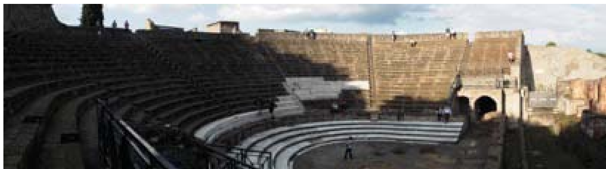
Figura 6. Teatro. Foto: Noemí Raposo, 2016