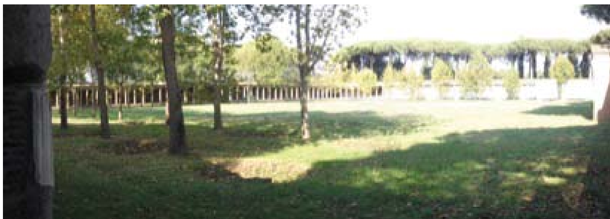
Figura 9. Palestra grande.