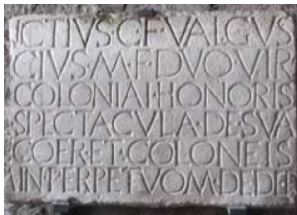
Figura 11. Inscripción de los constructores del anfiteatro. Anfitheatro.

12 Dig. 43, 4, 2. In muris aliquid facere, ex quo damnum aut incommodum irrogetur, non permittitur.