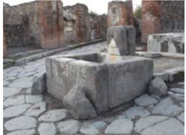
Figura 4. Fuente Via Consolare con Vico di Modesto, Pompeya. Foto: Noemí Raposo, 2016

pación de suelo perteneciente a un edificio público de espectáculo, por otro de sujeción de las cuerdas del velarium aprovechando que se encontraran ahí esas piedras, y por último el control peatonal de acceso al anfiteatro y vetar el acceso de los vehículos a esa zona (Figura 3). Igualmente ocurriría con las fuentes públicas en la ciudad romana de Pompeya, donde estas fuentes estaban rodeadas por termini , pero no solo tenían la función de delimitar el espacio público de las fuentes para no ser invadidas, sino que tenían una doble función, y es que posiblemente al mismo tiempo, servían como guardarruedas para que los carros al pasar no dañaran la estructura de la fuente (Figura 4). Por lo que, estos termini tenían su función principal de delimitación de espacios, pero eran aprovechados para otros usos (Raposo, 2017).