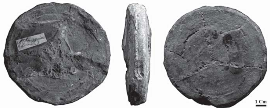
Fig. 2.- Espécimen MNCN 58644. Disco intervertebral de reptil marino indeterminado, proveniente del Jurásico de la Sierra de Albarracín.

En todos los tetrápodos la notocorda se divide en elementos intervertebrales formados por cartilago fibroso (Kardong, 2005), que pueden variar desde formas ovoides, al situarse entre centros vertebrales anficélicos, hasta formas discoidales planas, características de vértebras platicélicas o con tendencia a la platicelia (Kardong, 2005). La morfología de MNCN 58644 es compatible con la de estos elementos intervertebrales. Se han descrito casos de osificación de ligamentos y cartilagos, así como de co-osificación de varias vértebras caudales, en cetáceos (Martin Sander, 2000; Mulder, 2001), ictiosaurios (Lingham-Soliar y Reif, 1998), mosasaurios (Massare, 1997) y cocodrilos (Mulder, 2001), animales con gran especialización axial de la locomoción, realizándose en mosasaurios y