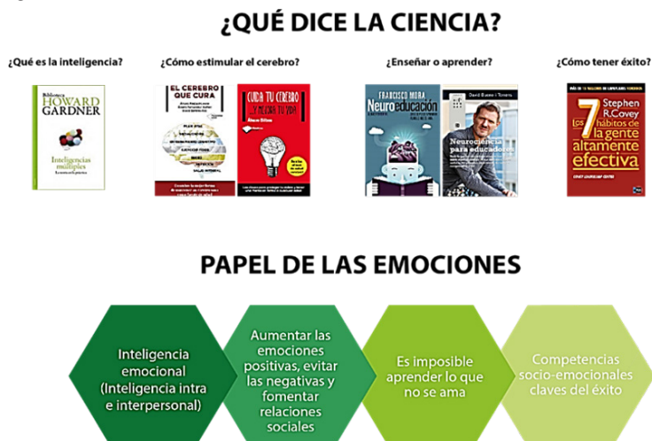
Figura 6.- Importancia de las emociones en el ámbito educativo (extraído de Sáenz-López, 2020)

Las emociones están presentes en todo momento e influyen en nuestra vida cotidiana consciente o inconscientemente (Brackett et al., 2004). En las últimas décadas está aumentando la cantidad de investigaciones que analizan su papel en aspectos vitales como la salud (Tajer, 2012) o el bienestar (Bisquerra, 2007). Más recientemente, se está investigando el papel de las emociones en el ámbito educativo (Sáenz-López, 2020). Entre las variables más significativas en este contexto, destacarían: el desarrollo de la inteligencia, la estimulación cerebral, el proceso de aprendizaje y las claves del éxito (figura 6).