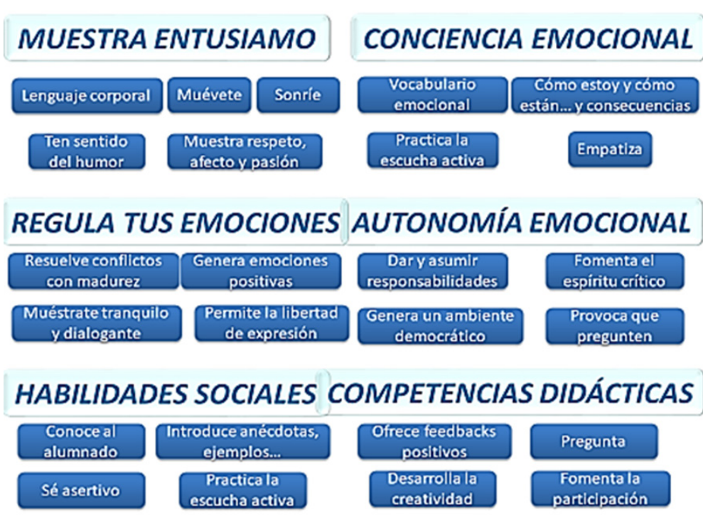
Figura 7.- Estrategias para mejorar el clima emocional (extraído de Sáenz-López et al., 2021).

Se han organizado algunas recomendaciones en cada una de las dimensiones de la herramienta de observación OCE incidiendo en la mejora de las categorías que se han descrito en el apartado anterior (Sáenz-López et al., 2019; Sáenz-López et al., 2021) (figura 7).