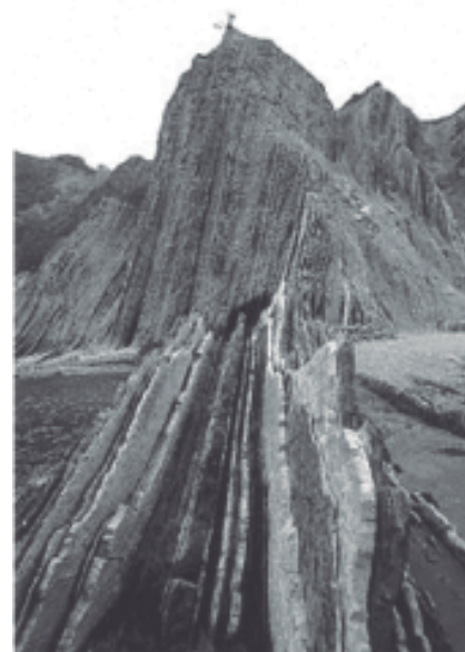
Fig. 1.- El Flysch de Zumaia.

Geológicamente, la zona estudiada forma parte de la Cuenca Vasco-Cantábrica, predominando los materiales cretácicos y terciarios que se disponen según direcciones generales WNW-ESE (Fig.2). En Guipúzcoa han actuado dos fases orogénicas: la hercínica que afectó a los materiales paleozoicos, y la alpina que afectó a la generalidad del territorio con una serie de pliegues, fallas, fracturas y diapiros. Los materiales que afloran en este tramo costero se formaron entre el