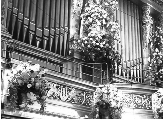
5. Detalle de la Sala Dorada del Musikverein de Viena. Nótese la decoración clásica con roleos y los adornos de flores.

leos de acanto, con los tallos serpenteantes poblados de animalillos y de toda clase de frutos, simbolizan la naturaleza ordenada y nutricia, presidida por Sol-Apolo, dios tutelar de Augusto, representado simbólicamente en los cisnes que aletean en lo más alto de los acantos. Los roleos expresan, con rara genialidad, la exuberancia y la vivacidad de una naturaleza ordenada y armoniosa para enaltecimiento del soberano en su condición de numen de la fecundidad y la prosperidad de Roma y del Imperio, animador de la felicitas temporum , la Edad de Oro cantada en sus Églogas por Virgilio.