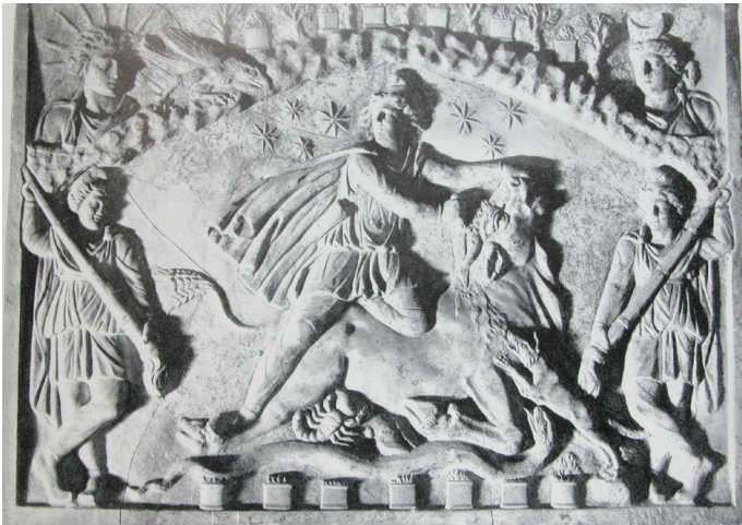
4. Relieve mitráico del Esquilino, Roma, con representación de Mitra-Sol sacrificando al toro.

Quizá la expresión más profunda de esa proyección divina del sol y de su percepción por el hombre se dio en las religiones místicas, asociadas íntimamente a las creencias ancestrales sobre la vida y la muerte de la naturaleza, incluida la humana. El sol se asociaba a dioses varones que simbolizaban el vigor fecundador de la tierra, la gran Diosa-Madre telúrica, y personificaban, además, a la vegetación misma. Como el sol y como la vegetación que de él dependía, estos dioses-soles experimentaban el comentado proceso de vida, muerte y resurrección, el mismo que, a su imitación, esperaban seguir los creyentes iniciados en los misterios. Destacaron en esta línea en época romana, y en religiones de raigambre oriental, dioses como Atis junto a la diosa Cibele o Magna Mater, de origen frigio; los egipcios Osiris e Isis; o el peculiar dios persa Mitra. Este último – Sol Invictus o Deus Invictus –, convertido en Roma en paladín de la lucha de la luz y el bien frente a la oscuridad y el mal, era muy seguido y venerado en su condición de dios renacido cada año – renatus – en el solsticio de invierno, lo que se celebraba el 25 de diciembre, fiesta del Natalis Invicti .