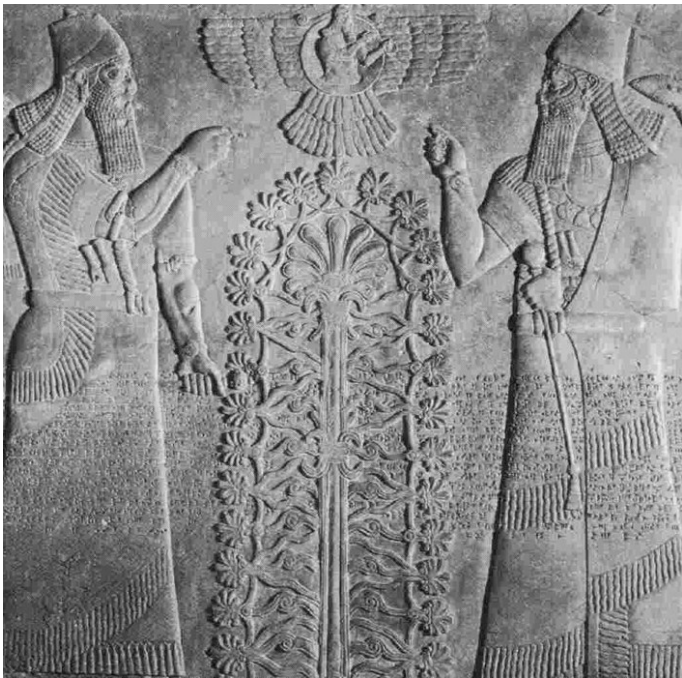
7. Relieve asirio con el Árbol de la Vida flanqueado por la imagen repetida del rey Assurnasirpal II.

A Roma llegaron por la vía de la adopción de los modelos helenísticos, estimulados por Alejandro en su aproximación a las tradiciones orientales. Y complace comprobar, en efecto, la proliferación en el arte mesopotámico de la idea de una naturaleza ordenada por la acción de un rey-dios numínico, manifiesta en las formas armoniosas y simétricas del llamado 'Árbol de la Vida'. Lo vemos en los relieves palaciales de los reyes asirios, sobrevolado por un dios solar, estrechamente asociado al monarca; y mucho antes, en la genial representación de un sello de la época de Uruk, del tercer milenio antes de nuestra Era, en la que el propio rey-dios Dumuzi, entendido como genio o numen de la vegetación y paredro