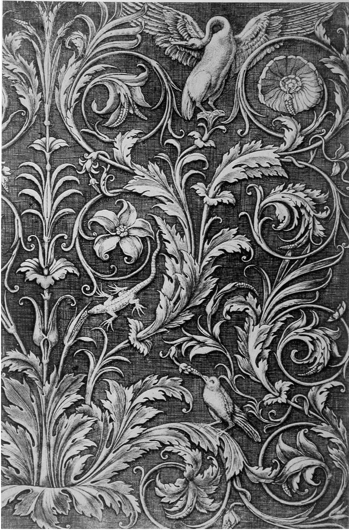
6. Detalle de los roleos del Ara Pacis , en un dibujo de Agostino Veneziano, del siglo XVI.