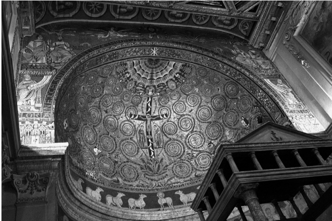
8. Mosaico del ábside central de la Basílica de San Clemente, de Roma.

He aquí la llegada del viejo motivo oriental y romano al lenguaje simbólico del Cristianismo y de nuestro mundo occidental, ingrediente simbólico apropiado a la significación religiosa y laica que impregna la ceremonia cívica del concierto de Viena.