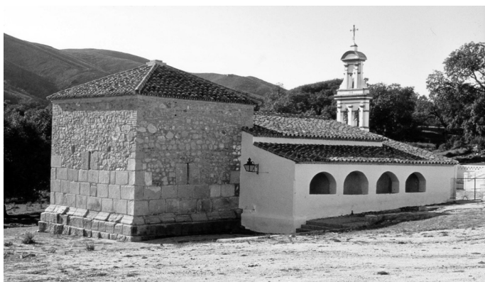
2. Ermita de Santa Eulalia, de Almonaster la Real, que aprovecha un sepulcro turriforme romano.