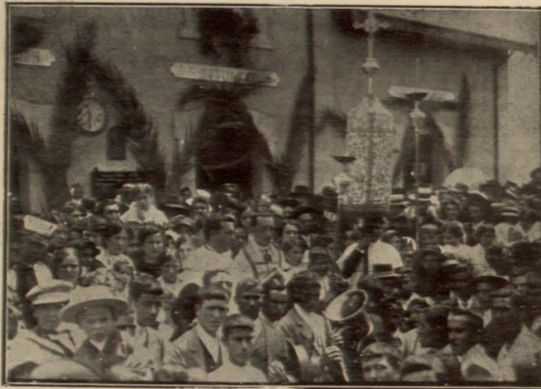
Santa Olalla.—Momento de bendecir la nueva línea ferrea, el día 25 del pasado mes.

La máquina había sido previamente exornada con esquisito gusto, ostentando en el frente un gran trofeo formado por el escudo de España y varias banderas nacionales entre flores y palmas; y trazadas con rosas las iniciales M. C. (Minas de Cala) a la altura de los topes. En