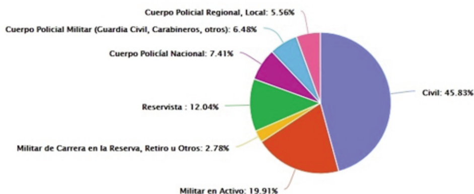
Gráfico 1. Origen de los alumnos por ocupación.

El porcentaje de alumnos extranjeros del CISDE es del 18,3%, con una mayor tasa de matriculaciones provenientes de Argentina, Perú y México, como naciones más representativas. No existían precedentes de que una institución especializada en la formación a distancia sobre seguridad y defensa que aglutinara alumnos de tan diversa procedencia, hasta la aparición de CISDE, en 2009.