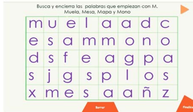
Figura 4. Actividad de encerrar palabras.

Una de las características que se tuvieron en cuenta con respecto a la intervención en el salón con los niños, fue el reducir al máximo la intervención externa de tal forma que fueron los mismo docentes los que aplicaran las pruebas, siendo ellos los que desde el primer día explicaban el uso de la Tablet como recurso, así como las partes de interacción, los botones y las instrucciones de trabajo, y luego posteriormente los mismos niños podrían repetir las instrucciones todas la veces que quería escuchándolas desde la propia Tablet (ver Figuras 5 y 6).