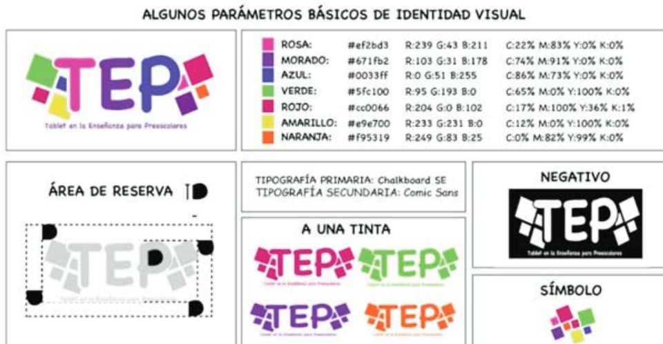
Figura 2. Identidad visual de la APP.

Uno de los principales problemas a resolver era como recoger la información de la actividad, y registra en que mesa o grupo de trabajo se realizó, para solventar este problema se generó una pantalla inicial donde se ingresaba el nombre número de la mesa a trabajar y una vez introducido este dato el resto de la interacción era auto-gestionado por los niños con las indicaciones, este nombre de trabajo se utiliza posteriormente como parte del nombre de las actividades guardadas, para que a la hora de juntar los datos se identifique siempre de que mesa provenía los datos (ver Figura 3).