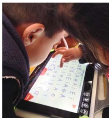
Figura 6. Evidencia de la intervención en donde los niños interactúan directamente con la Tablet de forma colaborativa.

Los tipos de actividades programadas son las correspondientes al nivel y punto de aprendizaje que le corresponde a los niños, las tareas fueron sugeridas por los docentes y posteriormente evaluadas si eran o adaptables a la Tablet en los tiempos previsto del proyecto, dentro de las tareas podemos destacar: