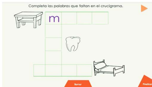
Figura 7. Pantalla de actividades de crucigramas.