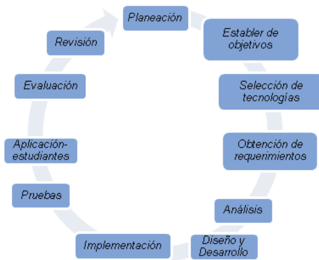
Figura 1. Esquema de las fases del modelo propuesto.