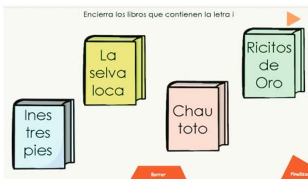
Figura 8. Pantalla de actividades de identificar letras.