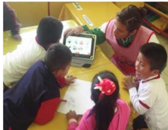
Figura 5. Evidencia de la intervención en el grupo experimental donde la docente explica una actividad.

Una de las características que se tuvieron en cuenta con respecto a la intervención en el salón con los niños, fue el reducir al máximo la intervención externa de tal forma que fueron los mismo docentes los que aplicaran las pruebas, siendo ellos los que desde el primer día explicaban el uso de la Tablet como recurso, así como las partes de interacción, los botones y las instrucciones de trabajo, y luego posteriormente los mismos niños podrían repetir las instrucciones todas la veces que quería escuchándolas desde la propia Tablet (ver Figuras 5 y 6).