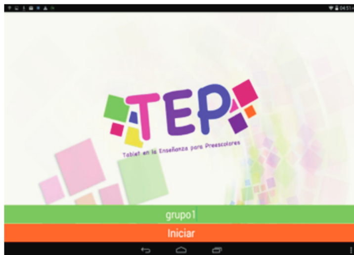
Figura 3. Sección de acceso del usuario de trabajo.

Uno de los principales problemas a resolver era como recoger la información de la actividad, y registra en que mesa o grupo de trabajo se realizó, para solventar este problema se generó una pantalla inicial donde se ingresaba el nombre número de la mesa a trabajar y una vez introducido este dato el resto de la interacción era auto-gestionado por los niños con las indicaciones, este nombre de trabajo se utiliza posteriormente como parte del nombre de las actividades guardadas, para que a la hora de juntar los datos se identifique siempre de que mesa provenía los datos (ver Figura 3).