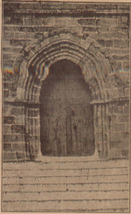
Puerta de la Epistola, en la Iglesia del Castillo

Labrada en granito del país. La componen arcos concéntricos ovoides de poca altura, formados por cilíndricos baquetones que se interrumpen en la resaltada imposta, continuando hasta el vértice de las ojivas. Es una construcción curiosa y de bastante mérito para los inteligentes.