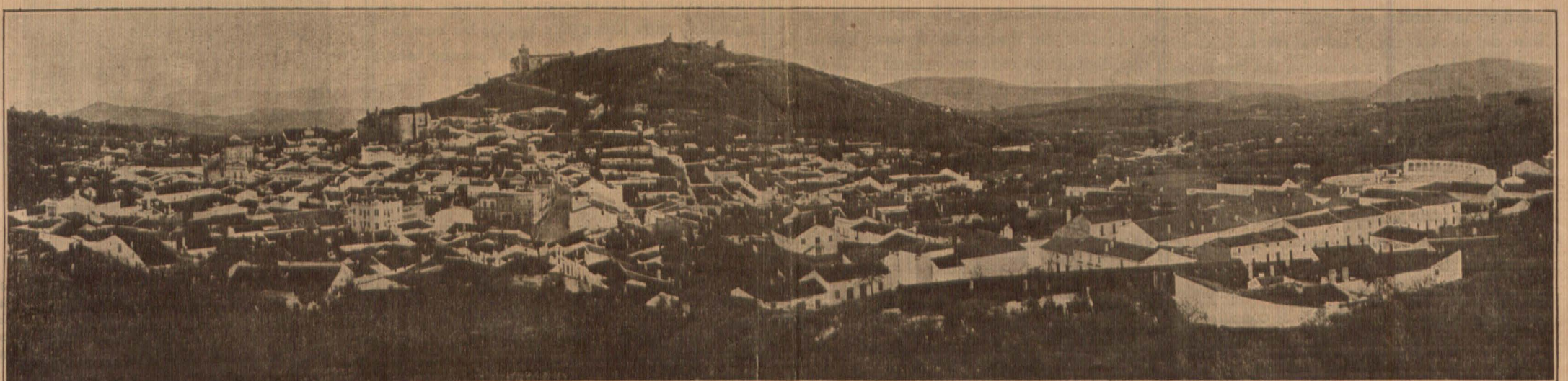
Vista general de la ciudad de Aracena

Pues bien: de la situación abusiva á que se había llegado, en lo que al plan general de carreteras, ya derogado, hacía relación, pasamos á la aplicación de las nuevas disposiciones legales; y con ellas, siguiendo el ejemplo de lo practicado en otros países, se asocian equitativa y justamente, por medio de públicos concursos, á la obra de gobierno las entidades locales, para que, en colaboración, se realicen las que se estimen útiles y necesarias, apartándose de prejuicios ó de caprichosas conveniencias, bajo la vigilancia y garantía de todos, aportando cada uno lo que pueda y le convenga en relación y á cambio de los beneficios positivos que,