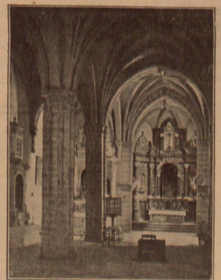
Interior de la Iglesia del Castillo

Lejos de nosotros el maniqueísmo que maldice la naturaleza y fulmina anatemas contra la materia.