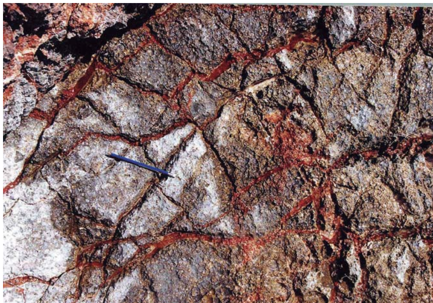
Fig. 2.- A) Detalle de un paleocolapso. Saragall d'en Pel.lo. Mallorca. B) Detalle de un conjunto de fracturas miocenas