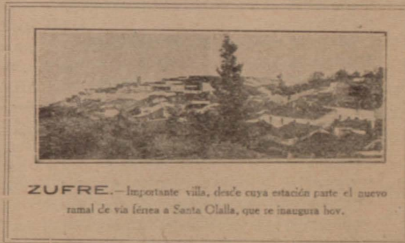
ZUFRE.—Importante villa, desde cuya estación parte el nuevo ramal de vía férrea a Santa Olalla, que se inaugura hoy.

"A mi padre le debo el vivir y a mi maestro el vivir bien". — Alejandro Magno, hablando de su preceptor Aristóteles.