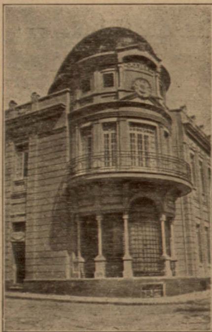
ARACENA.--Edificio que ocupa la sociedad "Arias Montano"

"donde la agricultura permanece estacionada, la industria desconocida o rudimentaria, y los medios rápidos y cómodos de comunicación brillan por su ausencia, concluye anulándose primero y desapareciendo después a consecuencia de una emigración paulatina" pregonaba con ardiente palabra y voz bien timbrada. un joven entristecido y apena-