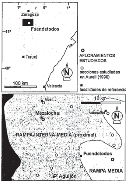
Fig. 1.- Localización de las tres series analizadas y reconstrucción paleogeográfica durante el depósito de la parte inferior de la Fm. Higuieruelas (Titónico).