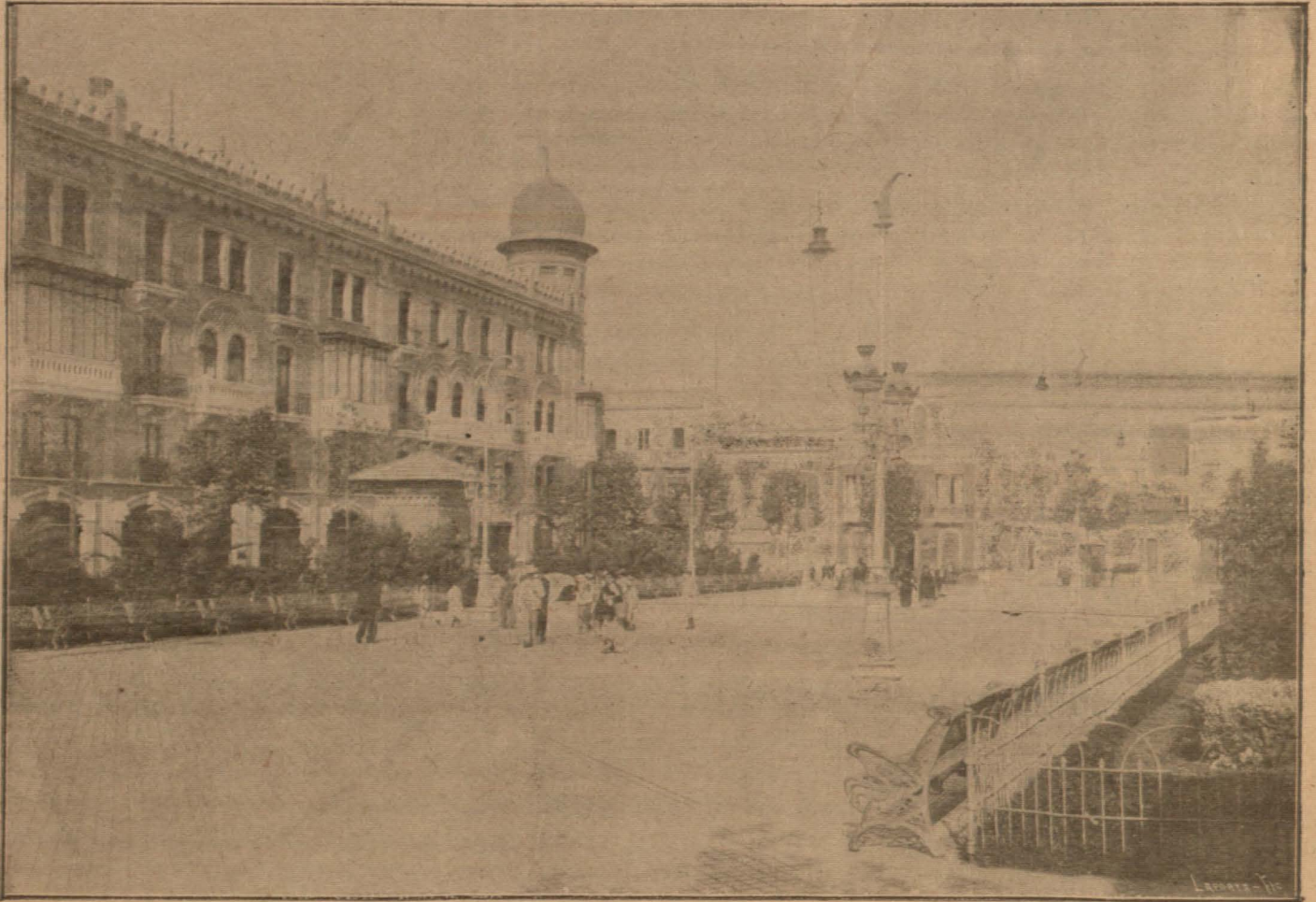
HUELVA.—La hermosa Plaza de las Morjas