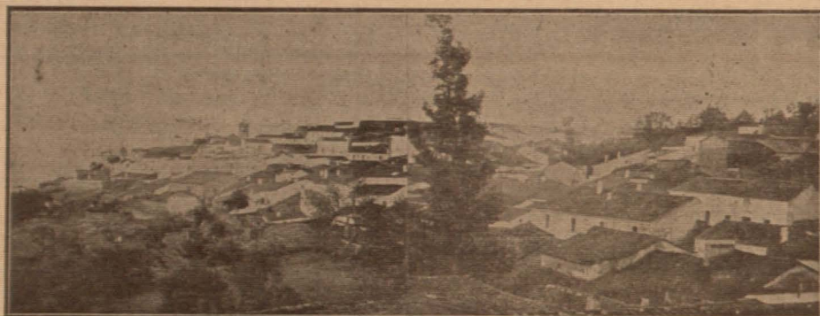
VISTA DE ZUFRE

Nosotros, por el lema que nuestra bandera ostenta, tenemos, entre las múltiples obligaciones que hemos aceptado, el deber de fomentar en Aracena y su distrito el amor al ahorro, indicando los medios más seguros para que resulte útil el esfuerzo económico de los humildes; é insistiremos al efecto sobre este tema.