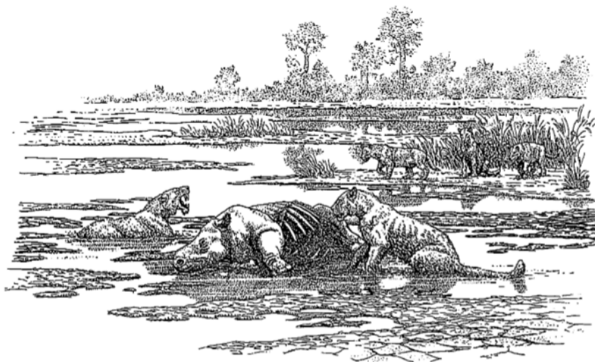
Fig. 3.—Reconstrucción de la fauna de mamíferos del Cerro de los Batallones, mostrando el posible origen de la acumulación de los huesos

Recibido el 30 de enero de 1992 Aceptado el 21 de febrero de 1992