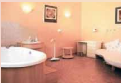
Un nuevo estilo de paritorio, más familiar y cercano, pero no menos seguro.

Observamos recurrentemente que la utilización del término "humanizar" genera reacciones de hostilidad en el ambiente de la