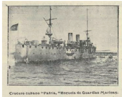
Figura 4. Crucero Patria . En La Rábida. Revista Colombina Iberoamericana , Huelva, Año IV, nº 38, 31 de agosto de 1914, p. 2.

Marchena Colombo —, pero también con que la visita coincidiese con la celebración de las Fiestas Colombinas, una circunstancia que el periodista resaltaría, con su habitual afectación, tanto por la procedencia de los marinos como por el motivo de la efeméride: