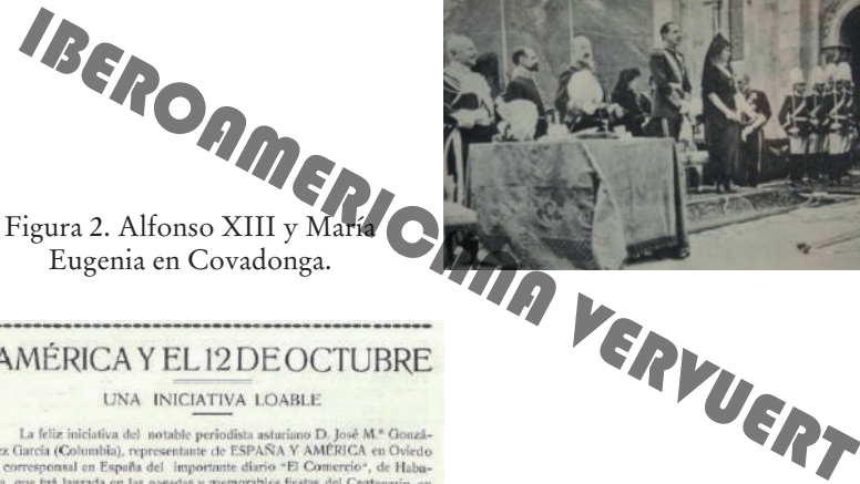
Figura 2. Alfonso XIII y María Eugenia en Covadonga.

ambos eventos no oculta la mayor trascendencia del formulado en Cádiz, una idea que ganó adeptos muy rápidamente dentro de un hispanoamericanismo siempre dispuesto a secundar todo aquello que resaltase el papel histórico de España. Así, si el nombre de Columbia ya había circulado por estos foros a raíz del centenario de la muerte de Jovellanos (fig. 3), 7 la nueva propuesta engrosaría su reputación dentro del movimiento, franqueándole las puertas de algunas de sus publicaciones. Entre ellas, las de las dos asociaciones que tan prestamente habían alentado su proposición gaditana: la Revista de la Real Academia Hispano-Americana de Ciencias y Artes de Cádiz y la onubense La Rábida .