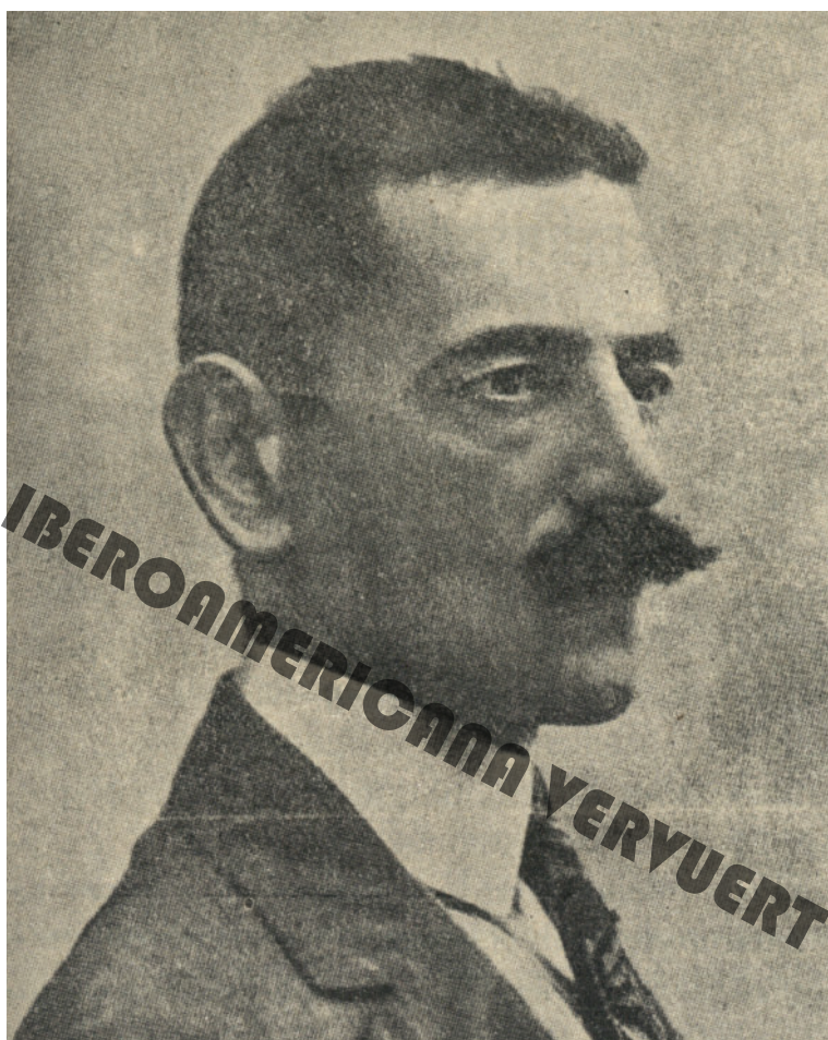
Figura 5. José de Diego. En La Rábida. Revista Colombina Iberoamericana , Huelva, Año VI, n° 63, 30 de septiembre de 1916, p. 13, < http://hdl.handle.net/10334/1404 >.

La Integridad Nacional para atacarlo, ampliando sus diatribas a aquella prensa peninsular que, en su opinión, daba alas a sus adversarios. 19 Durante la guerra ejerció como comandante del batallón voluntario