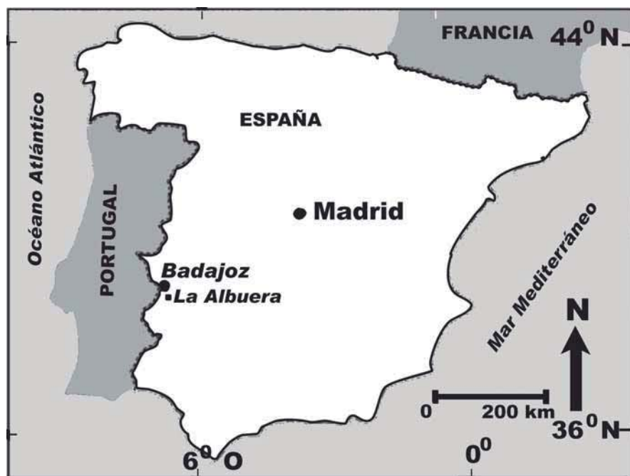
Fig. 1.- Situación geográfica del complejo lagunar de la Albuera.