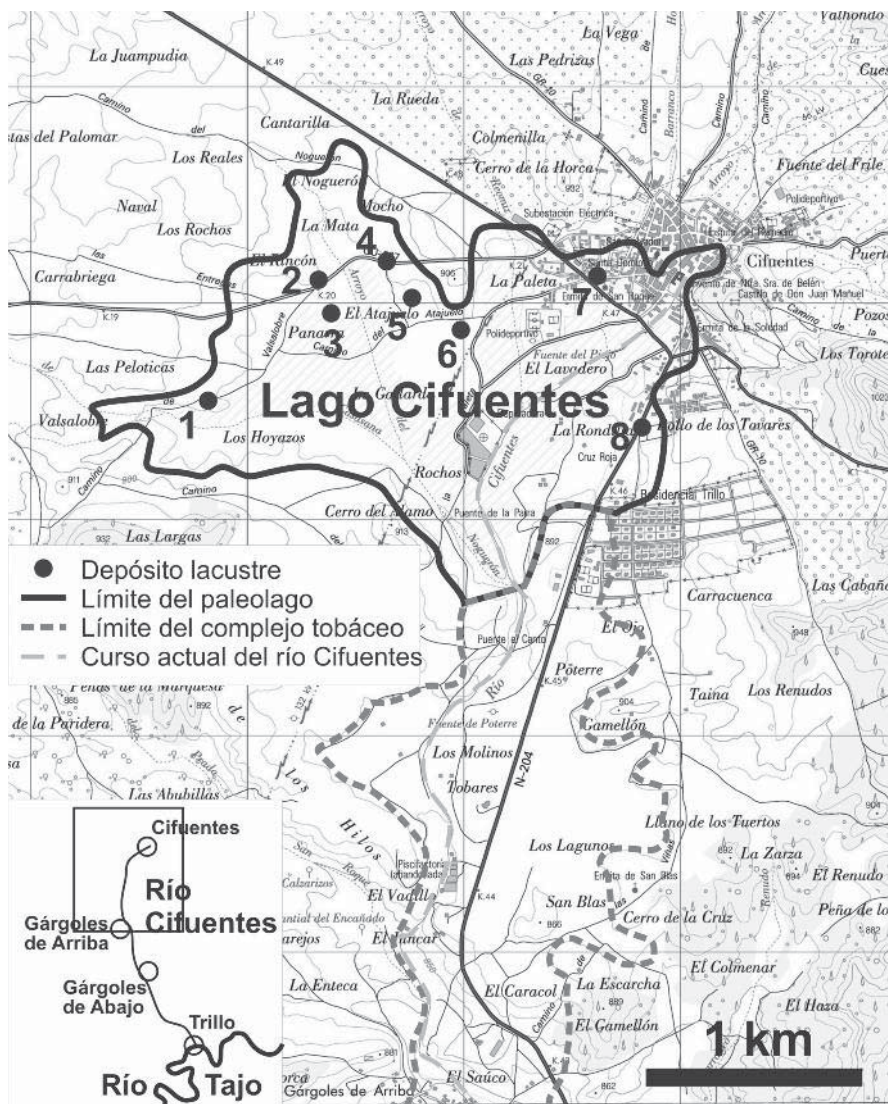
Fig. 1.- Extensión hipotética del paleolago y del complejo tobáceo que originó el represamiento del río Cifuentes en el Pleistoceno, con indicación de los afloramientos del nivel lacustre descritos en la tabla I y en el texto.

nivel, oscila entre los 40 cm del corte 1 y los 90 cm del corte 4 (Fig. 4). En las localidades