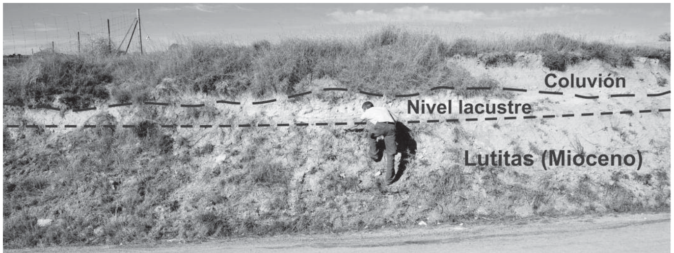
Fig. 2.- Afloramiento no. 4 del nivel lacustre, en el km 20,5 de la carretera de Solanillos del Extremo a Cifuentes. Véase también la figura 4.

Fig. 2.- Outcrop no. 4 of the lacustrine bed along km 20.5 of the road from Solanillos del Extremo to Cifuentes. See also figure 4.