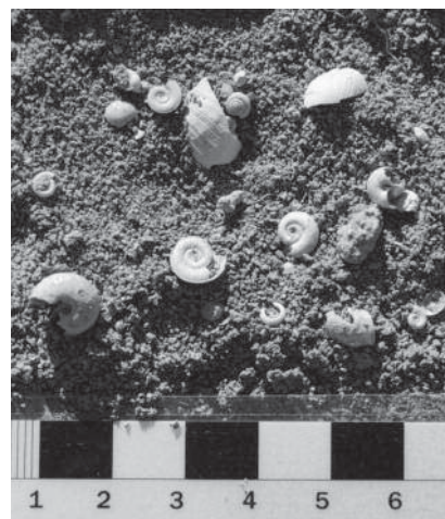
Fig. 3.- Fósiles de gasterópodos ( Planorbis y Lymnaea ) y bivalvos del afloramiento no. 1 del nivel lacustre. Véase situación en figura 1 y tabla I.

serva en el corte de la carretera a Solanillos (Fig. 2) y su entorno, el nivel lacustre se sitúa sobre esta superficie, de tal forma que, lateralmente hacia el oeste, ambos están disectados por el encajamiento remontante del perfil del Arroyo del Noguerón, dando lugar a una terraza.