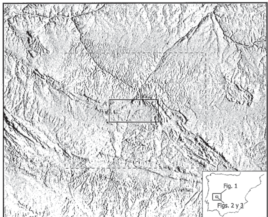
Figura 1: Localización del área de trabajo (rectángulo interior) sobre un modelo digital del terreno (S.G.E., 1995). El recuadro exterior (trazo discontinuo) supone una ampliación (deformada) para este sector del 200%.

La metodología de este análisis estructural consiste, simplemente, en cuantificar el desplazamiento ocurrido a lo largo del plano de falla de puntos inicialmente adyacentes. El hecho sería poco novedoso si no fuera por las dimensiones