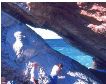
Fig. 2.- Muestreo de la sección de Loya.

En la actualidad, el afloramiento se localiza en la bahía de Loya, en un acantilado en el lado nordeste de la playa. La sección cretácica está conformada por margocalizas rojas y grises, seguida de un contacto neto con la sección paleógena, en parte erosionada en un hueco del acantilado. Los primeros centímetros del Paleoceno están formados por un nivel de arcilla margosa gris oscuro seguidos por margocalizas grises en el resto de la sección estudiada, sobre las cuales se encuentra un potente estrato calizo. Pioneros en el estudio de este corte fueron Lacazediou et al. (1996), trabajo que nos permitió encontrar la sección y muestrearla (Fig. 2).