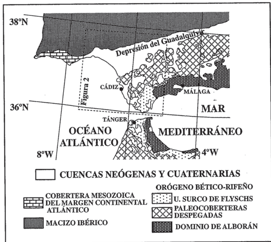
Fig. 1. Esquema tectónico en el Sur de la Península Ibérica y Norte de Marruecos.

Sobre el Dominio de Alborán hay cuencas que actualmente están aisladas entre sí, formadas desde el Aquitaniense hasta el Plioceno (Rodríguez Fernández, 1982; Comas et al. , 1992). Estas cuencas, que han sido objeto de numerosos estudios, son interpretadas en relación con diversos episodios de rifting que han contribuido al adelgazamiento cortical detectado en el Mar de Alborán. En el bloque de muro del CCG también se han originado cuencas neógenas sobre los materiales mesozoicos que forman parte del Dominio Sudibérico. La Depresión del Guadalquivir es la cuenca terciaria más grande al Sur del Macizo Ibérico (Fig. 1). El límite meridional de dicha cuenca es tectónicamente complejo y más activo que el borde septentrional.