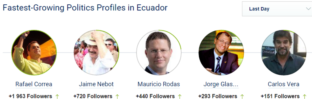
Gráfico N° 1 Crecimiento de figuras políticas en Ecuador

Según el portal Freedom House ( https://freedomhouse.org/report/freedom-net/2014/ecuador ) en Ecuador existe un aproximado de 2.500.000 usuarios en Twitter hasta mayo de 2014. Este mismo portal cita los políticos con mayor crecimiento en redes en Ecuador. Hasta el 19 de febrero de 2015 los cinco más populares en la Red son Rafael Correa (Presidente del Ecuador) con un avance de +1963 seguidores. Le sigue Jaime Nebot (Alcalde de Guayaquil y opositor a Correa) con +720. Posteriormente Mauricio Rodas (Alcalde de Quito y candidato a presidente en 2013) con +440. Luego Jorge Glass (Vicepresidente del Ecuador) con +293 y Carlos Vera (expresentador de televisión y activista político) con 151 seguidores (SocialBakers, 2015).