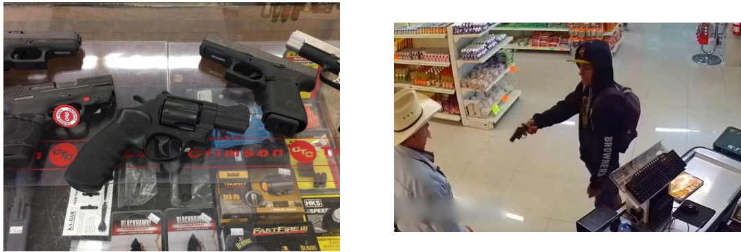
Figura 3. A la izquierda: Imagen de arma de fuego sin contexto. A la derecha: Imagen de arma con contexto.

empuñada. A continuación, en la Figura 3, se puede observar un ejemplo comparativo.