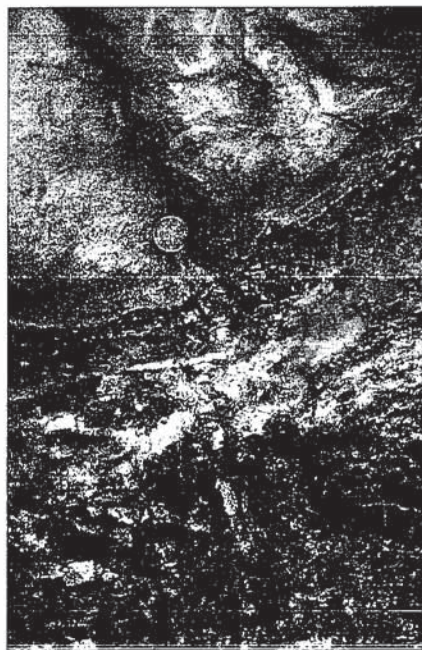
Fig. 2.- Límite K/T entre las formaciones Vía Blanca y Peñalver (entre las dos monedas) en el corte Peñalver.

Fig. 2.- K/T boundary between the Vía Blanca and Peñalver formations (between the two coins) at Peñalver section.