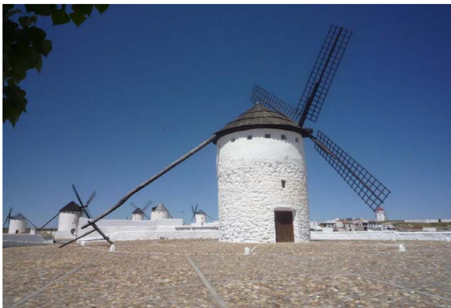
Figura 3. Los Molinos de La Mancha (Campo de Criptana).

La llegada de los ilustrados, a lo largo de la segunda parte del siglo XVIII, coincidió con la transformación de los caminos en carreteras. Mientras los viajeros españoles nos aportaron la perspectiva, las anécdotas y los detalles del recorrido; por su parte, los extranjeros ofrecerán una visión más impactante, centrados en los elementos construidos, especialmente los molinos y la diversidad de cultivos. Townsend (1786-1787) tras hacer mención a las ventas, las posadas, las norias y a la abundancia de mulas para el arrastre, llamándole la atención la ausencia de bueyes, comentará la existencia real de molinos de viento “que de hecho los pudimos ver, tal y como imaginábamos, cerca de cada pueblo” (Figura 3). Por su parte, el barón de Bourgoing (1797-1798), en su recorrido de Aranjuez a Cádiz, tras hacer hincapié en la extensa llanura perfectamente uniforme, en su aridez, en las vastas y fértiles tierras, así como en la abundancia de trigos, indicará que esporádicamente aparecen escasos olivos y menos viñedos de los esperados, a pesar de ser estos vinos muy consumidos en España, pues tanto Valdepeñas como Manzanares representan la “patria del buen vino de la Mancha”, siendo el blanco de consumo menos frecuente que el tinto. Este autor hará también una referencia a la cultura del azafrán, considerada la principal riqueza en La Mancha oriental.