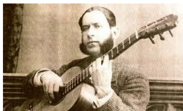
Figura 6. Silverio Franconetti

En el siglo XVIII, tuvo lugar las primeras manifestaciones del canto jondo, concretamente en territorio andaluz debido al mestizaje existente. En un comienzo, este tipo de canto se realizaban dentro del ámbito familiar, todo era muy íntimo, pero a principio del siglo XIX comienza a difundirse a distintos espacios públicos como tabernas o cafés de cantantes, dejando el flamenco de ser parte solo de la comunidad gitana. Silverio Franconetti fue el primer cantaor en abrir un café cantante en la ciudad de Sevilla en 1870, donde tiene sus orígenes el flamenco en Andalucía, por todo ello, este es considerado el padre del cante flamenco. (Martínez-Bonilla, 2023).