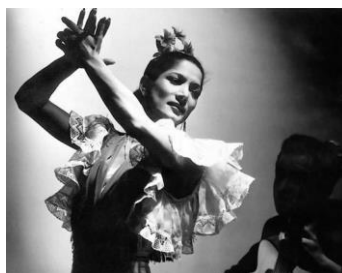
Carmen Amaya (bailaora flamenca)