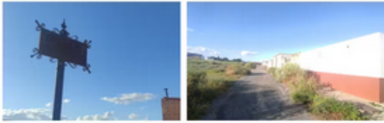
Rótulo destruido de calle Gloria Fuertes y calle Rosalía de Castro sin rotular ni asfaltar.