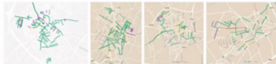
Distribución de las calles con nombre de hombre (en verde) y con nombre de mujer (en morado) en cuatro municipios onubenses (Almonte, Bollullos Par del Condado, Trigueros e Hinojos).

Seguro que si salimos del centro y vamos leyendo lo que nos dicen los rótulos de cada esquina, primero nos encontraríamos con políticos, militares, reyes o eclesiásticos, incluso con santos o vírgenes. Conforme nos alejásemos del centro estaríamos con escritores, artistas, científicos o maestros, puede que hasta algún noble tenga su nombre en algún rincón. Cuando llegásemos a los márgenes, a las zonas residenciales, industriales o agrarias de la localidad, es probable que nos encontrásemos quizás con una escritora, una política o alguna mujer relevante para la historia local que a lo mejor usted, que no vive en esas calles y ha salido del centro, ni sabía que estaban ahí.