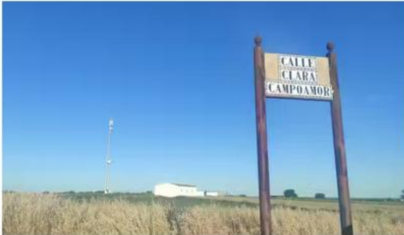
Rótulo de la calle Clara Campoamor, en Beas (Huelva).