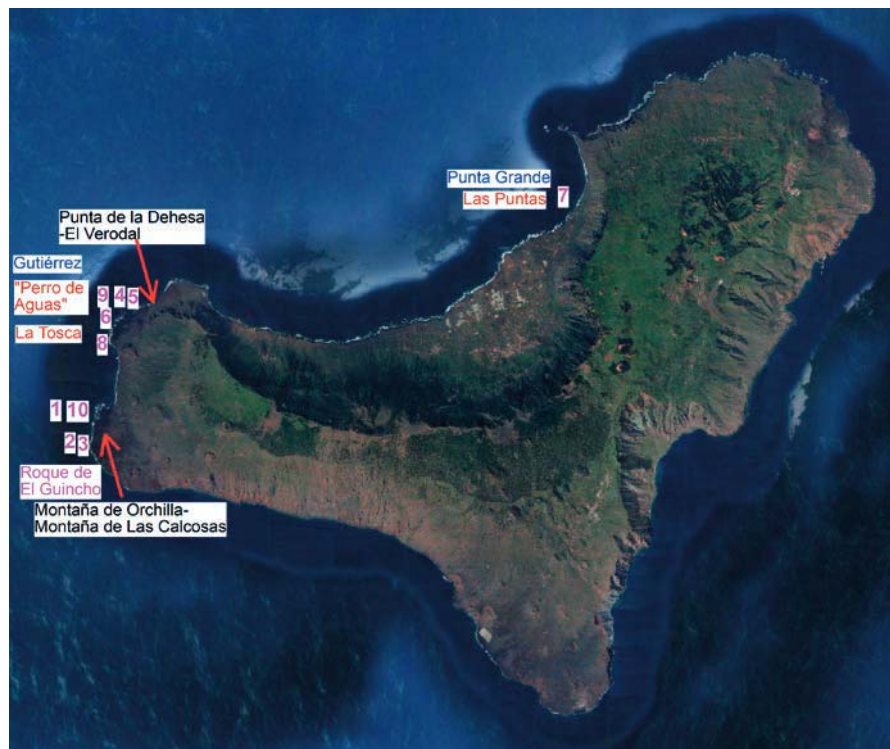
Fig. 1. – Posición de los lugares indicados en el texto. En rojo aparecen los arcos, en azul, las "puntas". Los números en rosa se refieren a los lugares que aparecen en las fotos de la figura 3.