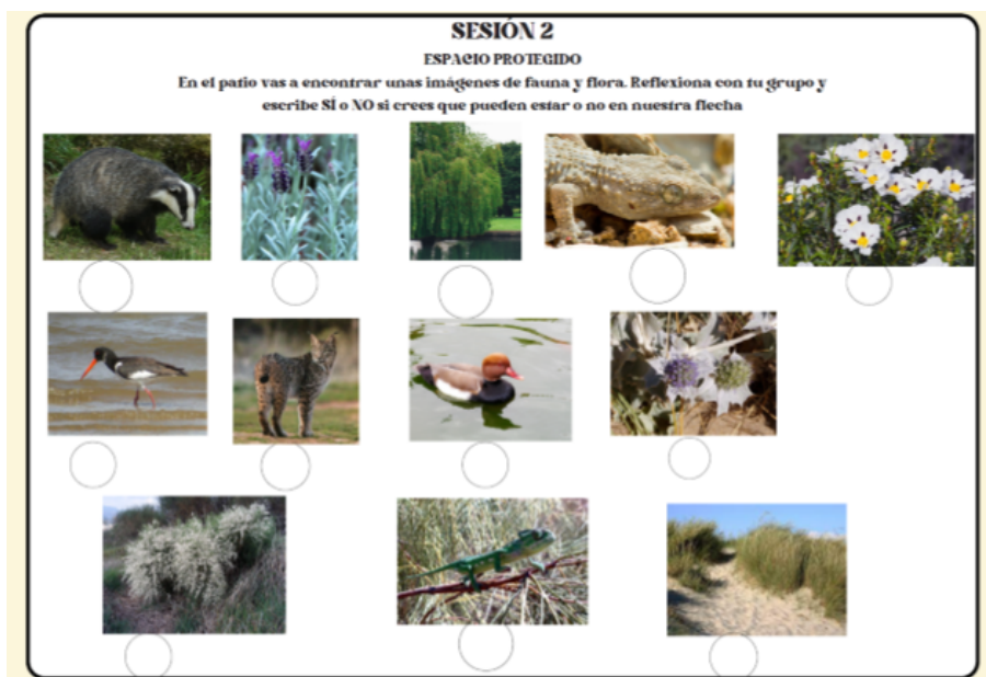
Figura 3. Cuaderno de campo - Sesión 2

En el cuaderno de campo, los estudiantes encontrarán varias imágenes de animales y plantas (figura 3) y se les pedirá que indiquen si creen que son propias de la Flecha del Rompido o no. Además, se les solicitará que asocien el espacio protegido con cinco palabras.