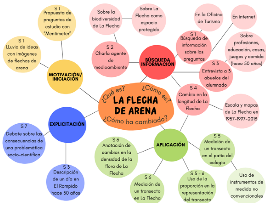
Figura 2. Fases y actividades de la situación de aprendizaje

De esta manera, se plantean 7 sesiones diseñadas e implementadas para trabajar las actividades que se esquematizan en la figura 2 (donde Si alude a la sesión i-ésima).