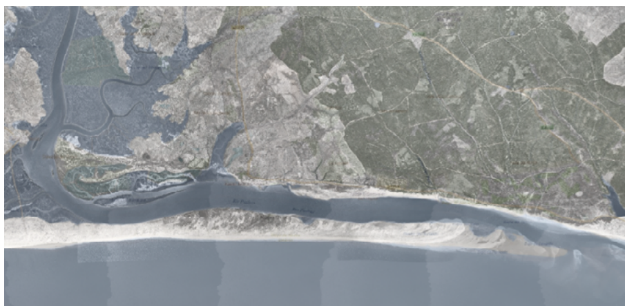
Figura 4. Fotografías aéreas superpuestas de 2013, 1977 y 1957

Se les proporcionará a los estudiantes tres fotografías aéreas de la Flecha, como las de la figura 4, una del año 1957, otra del año 1977 y la tercera del año 2013, todas a la misma escala. Se les pedirá que comenten en grupo qué observan en ellas, centrándose en los cambios visibles a lo largo del tiempo. Dado que la longitud es la magnitud más notable en cuanto al cambio durante esos años, en esta sesión se les pedirá a los estudiantes que calculen las diferencias de longitud que observen.