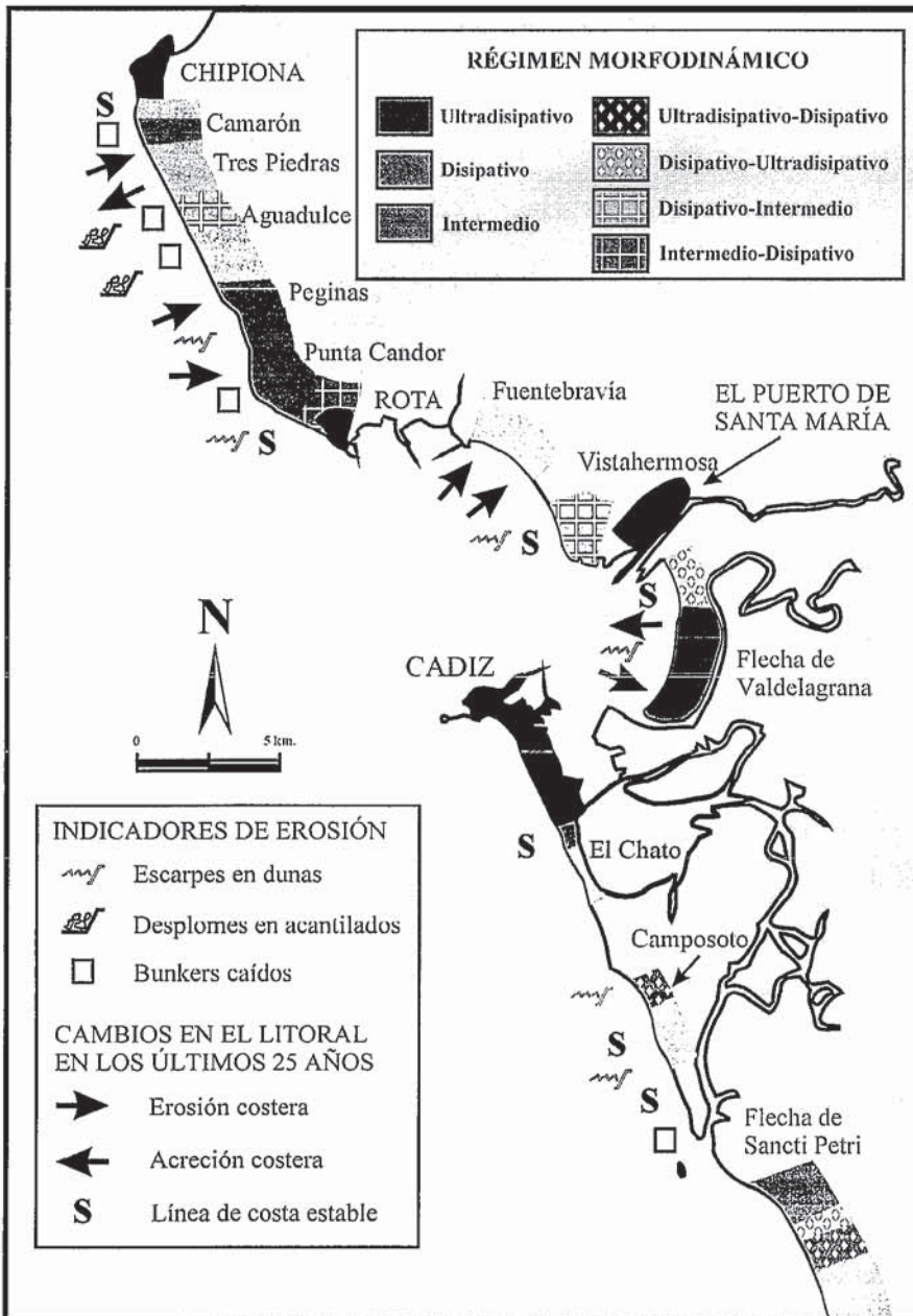
Fig. 3.- Mapa de estados morfo-erosivos de playas en la Bahía de Cádiz.