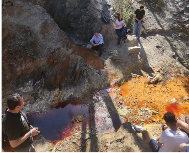
Figura 1. Fotografía de la visita a la cabecera del río Tinto en la Sierra de Padre Caro (Huelva).