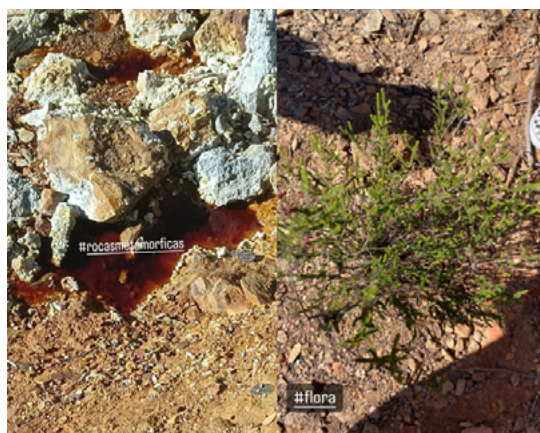
Figura 3. Fotografías realizadas por alumnos representando con hashtags parte de la geología y biología de la zona.

El estudio de la acidez del río y su impacto se desarrolló a partir de preguntas surgidas de su curiosidad, como: «¿Cómo nos afecta?». En concreto, el alumnado investigó en diversas fuentes proporcionadas por el docente, sobre los efectos del pH ácido del río en organismos vivos y, en especial, en el ser humano. A su vez, con el objeto de que el estudiante conociera el resto de las características fisicoquímicas, se planteó cuáles de ellas eran necesarias para caracterizar cualquier río. Esto dio pie a que cada grupo concretara una característica con su definición, unidad e instrumento de medida. En este sentido, debido a la imposibilidad de adquirir algunos de los instrumentos, se originó la necesidad de construirlos. En concreto, a través de la programación basada en bloques realizada en Makecode.org , se construyeron algunos sensores conectados a placas controladoras BBC Micro Bit , que se usaron para la toma de datos en una salida de campo al río Tinto.