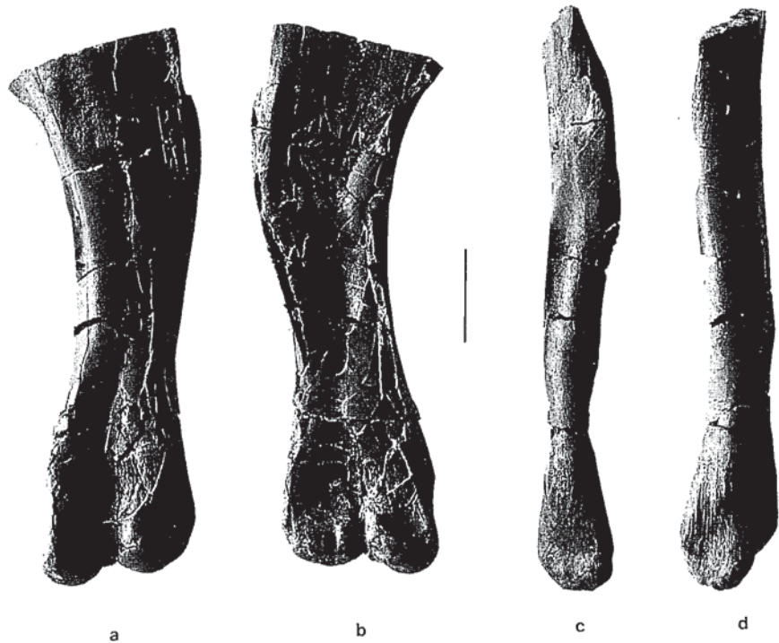
Fig. 2.- Húmero derecho de Iguanodon sp. (GGV98/1), en vistas posterior (a), anterior (b), lateral (c) y medial (d). Escala: 10 cm.

En España las colecciones de Iguanodon más completas están en Galve (Teruel) y Morella, aunque también hay restos en otros yacimientos de Burgos, Castellón, Cuenca y Teruel (Ruiz-Omeñaca et al. , 1988), pero GGV98/1 es el primer húmero de iguanodóntido encontrado en España, por lo que no puede hacerse una comparación con otros materiales españoles. En GGV98/1 no puede observarse la curvatura pues falta la parte proximal, por lo tanto no podemos saber si se trata de un ejemplar adulto o un juvenil. Por su tamaño y edad podría asignarse a I. bernissartensis , pero podría ser de « Gravisaurus » o de un individuo extremadamente adulto de otras especies de Iguanodon . Debido a la falta de una descripción formal de « Gravisaurus », y a que éste únicamente se ha citado en el Aptiense superior de Níger, pensamos que el húmero pertenece a alguna especie de Iguanodon . Puesto que el húmero parece ser un hueso poco diagnóstico y el tamaño grande no debería ser tomado como un carácter específico preferimos determinar el resto como Iguanodon sp.