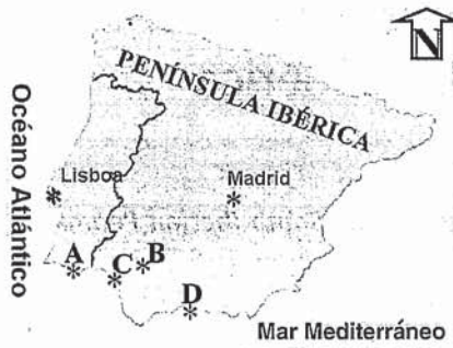
Fig. 1.- Situación geográfica de los puntos estudiados. A: Playa de Galé-Albufera. B: Lora del Río (Sevilla). C: Bonares (Huelva). D: Estepona (Málaga).