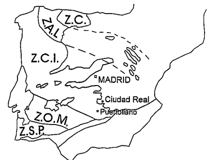
Fig. 1.- Situación geográfica y geológica de Puertollano. Z.C.: Zona Cantábrica; Z.A.L.: Zona Asturoccidental-Leonesa; Z.C.I.: Zona Centro Ibérica. Z.S.P.: Zona Surportuguesa. Según Julivert et al. (1974).

petroquímico, y áreas situadas en las proximidades de los accesos a central térmica y explotaciones mineras. Por otra parte, el hecho de que la ciudad se localice en un puerto de cierta importancia, entre los referidos cerros, establece una cierta compartimentación entre las zonas Norte y Sur de la misma.