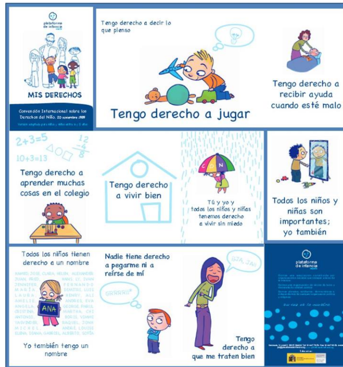
Imagen n o 1: Los Derechos del Niño a partir de: Plataforma de Infancia http://goo.gl/jHg0r3 [Consultado el 11 de abril de 2016]

(entendidos como parte importante actualmente de la vida “social, cultural, artística y recreativa”)” viene recogido en distintas leyes, como la anteriormente citada, así como es considerado por la ONU un Principio Fundamental (junto con: la no discriminación, el interés superior del niño, el derecho a la vida, a la supervivencia y al desarrollo) que sustentan los Derechos del Niño (imagen n o 1) aprobados en su Asamblea en 1989.