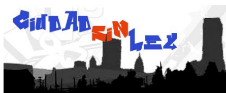
Imagen nº2: Logo del programa "Ciudad sin ley" de Uniradio.

En la radio de la Universidad de Huelva se han llevado a cabo, desde hace ya varias temporadas, programas elaborados conjuntamente con el equipo de profesores y de orientadores de varios Colegios e Institutos de la provincia, llegándose a incorporar esta actividad dentro del currículum regular de alguna de las asignaturas. En la actualidad por ejemplo, una vez a la semana realizan su programa los menores del Colegio Ciudad de los Niños de Huelva, cuyo título es "Ciudad sin Ley".