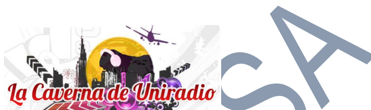
Imagen nº 3: Logo del programa "La caverna" de Uniradio.

La misma situación sucede con otros menores, en este caso de una etapa educativa superior perteneciente al IES La Marisma de Huelva que también, una vez a la semana, realizan su programa de tinte social, filosófico y cultural "La Caverna".