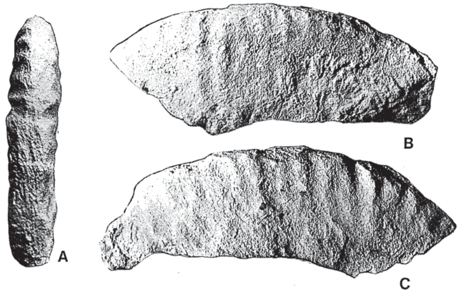
Fig 2.- Ejemplar CU1-135-9. Geysantia sp. gr. Geysantia sp. nov. A. MELÉNDEZ. Vistas ventral (a), lateral izquierda (b) y lateral derecha (c). Ilustraciones a tamaño natural. Ejemplar procedente del Oxfordiense superior. Zona Bimammatum, en el perfil CU1 (Cuber, Mallorca).

Alvaro, M., Barnolas, A., Del Olmo, P., Ramírez Del Pozo, J. y Simó, A. (1984): Estratigrafía del Jurásico ,