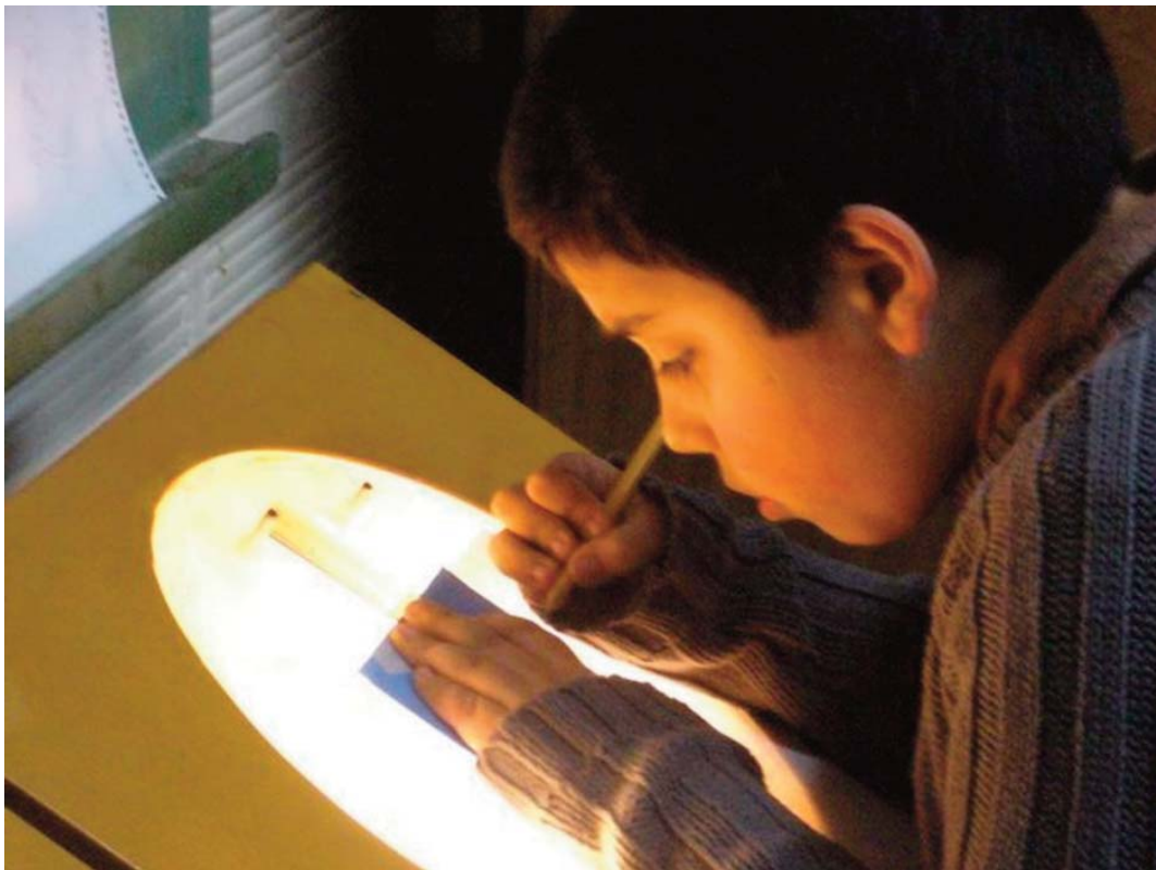
■ TALLER Chicos y chicas se expresan con mensajes visuales

proyecto de un curso de cine para niños a la Dirección del CEVAO, Centro Educativo de Artes Visuales y Artesanías y Oficios, una institución que hasta ese momento sólo atendía la enseñanza de artes a adultos. Fue aprobado para un taller anual, aunque a final de año, al presentar las películas en la Casa de la Cultura (Vicente López) los participantes mostraron su interés en continuar para seguir profundizando.