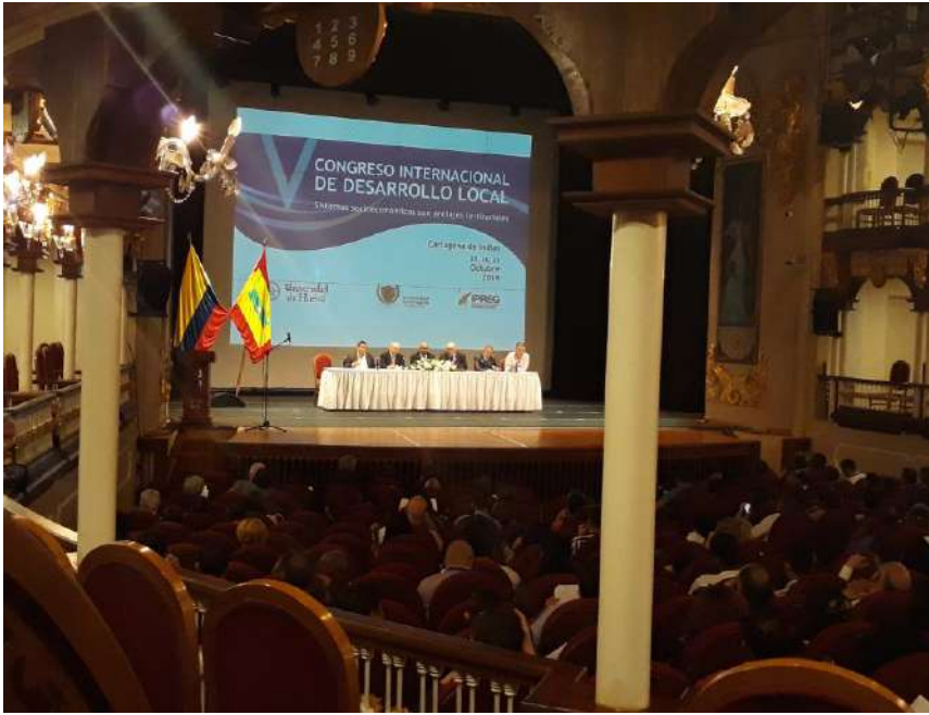
Figura 15. Claustro de la Facultad de Ciencias Humanas de la Universidad de Cartagena de Indias, sede del V Congreso (30 de octubre de 2019)