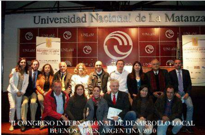
Figura 6. Desarrollo del II Congreso (La Matanza)