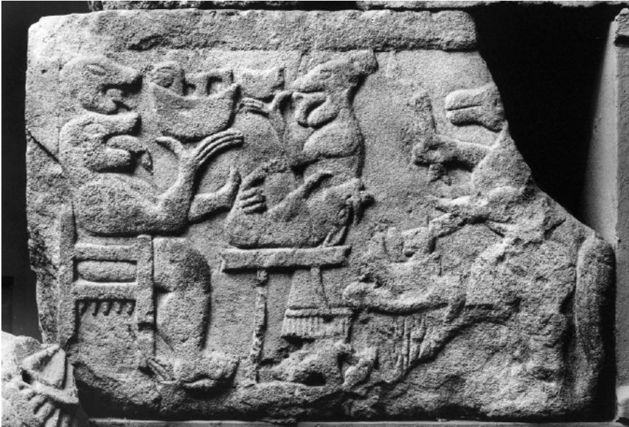
Fig.5: Relieve del banquete del conjunto monumental de Pozo Moro.

ría en tal caso la provincia de Albacete, en la que encontramos las primeras “evidencias” de banquete funerario ibérico, y en la que comprobamos que todavía existe el recuerdo (al menos en un plano mitológico, pero en todo caso presente en el imaginario colectivo) de los antiguos banquetes orientales relacionados con el mundo de la ultratumba, tal y como se pone de manifiesto en el conocido relieve de Pozo Moro 114 . De hecho, en relación con éste último merece la pena recordar la cercanía (física y, según la interpretación de sus excavadores, cronológica) entre dicho relieve, en el que se representa un banquete de tipo oriental, y el ajuar del servicio del vino con iconografía simpótica que se encontraba a sus pies 115 , o mejor aún, los restos faunísticos con marcas de consumo humano documentados alrededor y que nos estarían hablando, de ser correcta su interpretación y datación, de la realización de banquetes funerarios en la propia necrópolis.