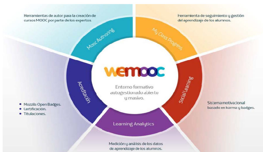
Figura 3. Los Componentes del Modelo de Miriada X

Los componentes del modelo de MiriadaX consta de MoocAuthoring (herramientas de autor para la creación de cursos MOOC por parte de los expertos), Miss ClassProgress (herramientas de seguimiento y gestión del aprendizaje de los alumnos), Social Learning (sistema motivacional basados en karma y badges), LearningAnalytics (medición y análisis de los datos de aprendizajes de los alumnos) y Acreditación (Mozilla Open Badges, Certificación y titulaciones). Todo ello conforma un entorno formativo autogestionado, abierto y masivo.