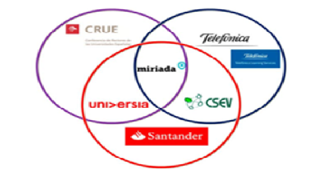
Figura 1. Agentes implicados en MiriadaX

Hasta el año 2012 las plataformas proveedoras de MOOC parecían estar casi bajo la hegemonía del ámbito académico estadounidense. Con la creación de MiriadaX, a finales de 2012, surgió la primera iniciativa de magnitud ajena al contexto norteamericano, precisamente en España, cuando Telefónica LearningServices y Universia lanzaron el proyecto de MiriadaX con el objetivo de ofrecer MOOC impartidos por las universidades iberoamericanas de la red Universia. Comenzó a funcionar con la oferta de MOOC oficialmente el 10 de enero de 2013 y tras doce meses de andadura cuenta con más de 280.000 visitas.