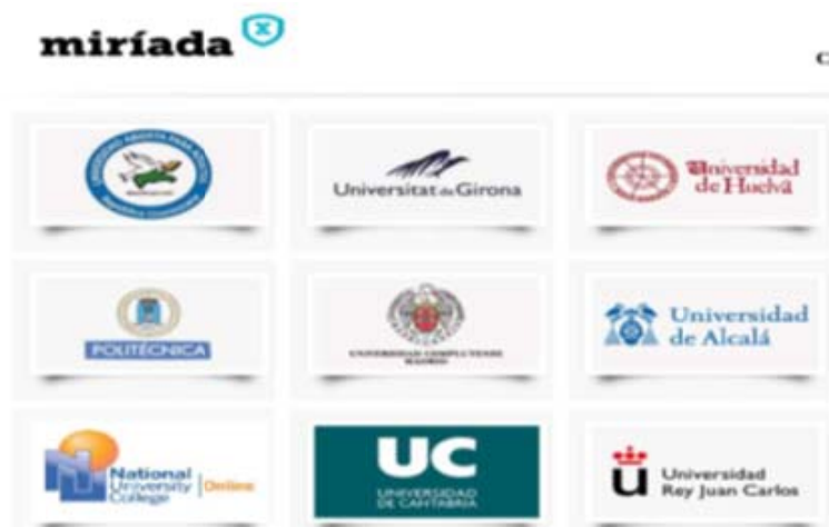
Figura 5. Instituciones participantes