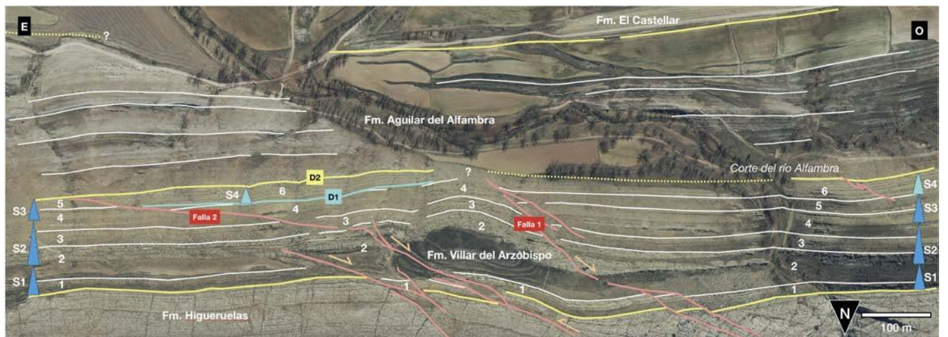
Fig. 2.- Ortoimagen y cartografía del afloramiento localizado al oeste de Aguilar del Alfambra. En la Formación Villar del Arzobispo se han diferenciado seis tramos cartográficos (1–6) y las secuencias S1 a S4. Se muestran asimismo las discordancias D1 y D2 y las fallas normales 1 y 2. Ver figura en color en la web.

En torno al límite entre las formaciones Villar del Arzobispo y Aguilar del Alfambra se han cartografiado dos discordancias (D1 y D2), cuya génesis se relaciona con la actividad de dos fa-