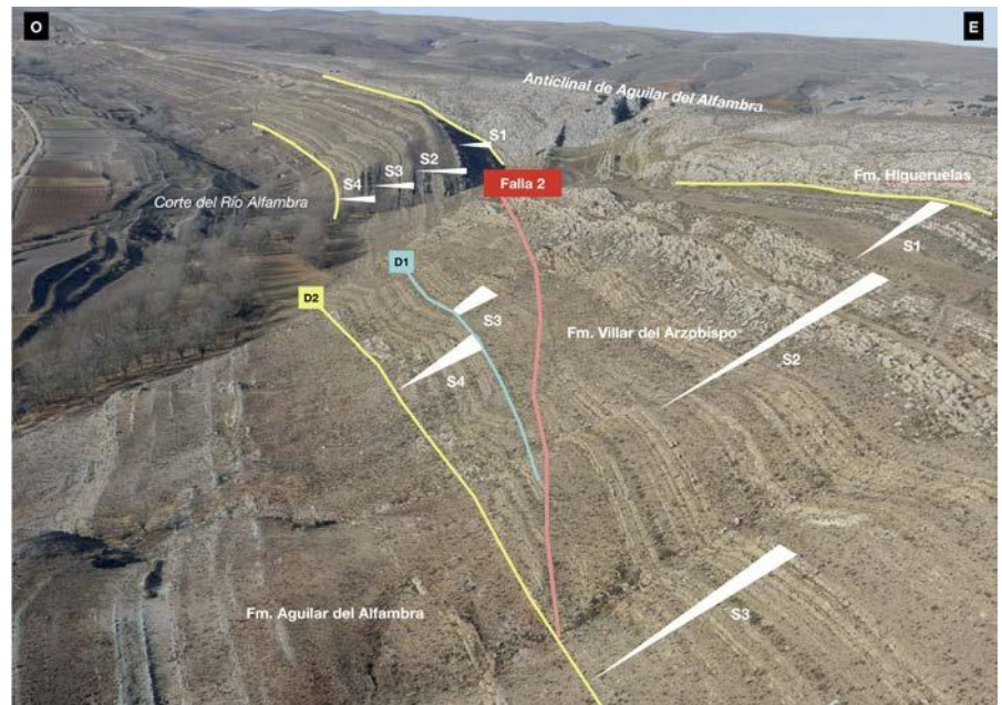
Fig. 3.- Imagen aérea (tomada con dron) del afloramiento estudiado (con capas subverticales), donde se muestran las discordancias D1 y D2, la falla 2 y la distribución de las secuencias S1 a S4 diferenciadas dentro de la Formación Villar del Arzobispo. Ver figura en color en la web.

Posteriormente, tras el depósito de la Formación Villar del Arzobispo (tramo 6, S4) se genera una falla normal (falla 2), de menor buzamiento, en el bloque inferior de la primera. La actividad de esta falla determina la conservación de la secuencia S4 en su bloque hun-