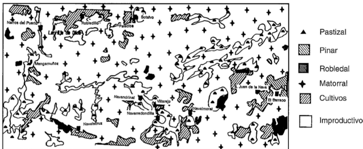
Fig. 2.— Mapa de vegetación de la Sierra de la Paramera